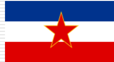
Vlajka SFRJ 1946-1992