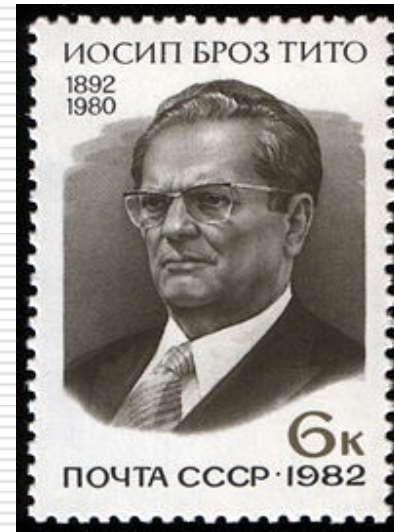
Poštovní známka Sovětského svazu, Josip Broz Tito, 1982