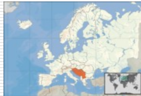
Pozice v Evropě