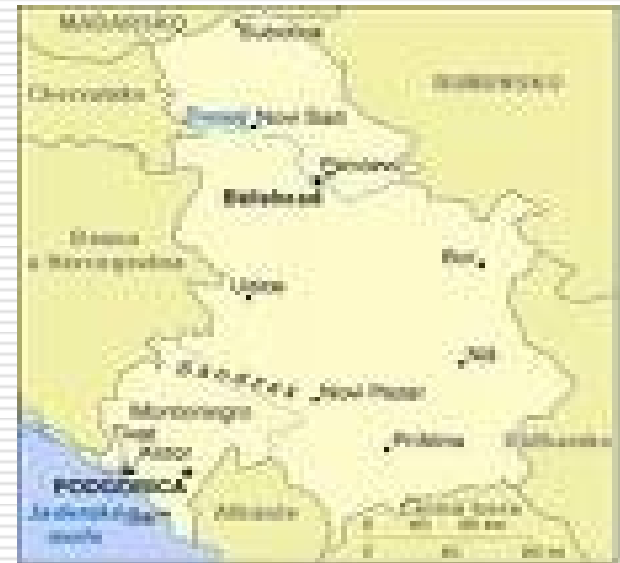
Mapa bývalé Jugoslávie