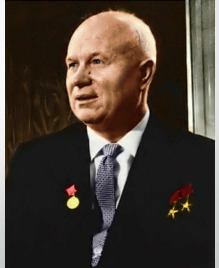
Nikita Sergejevič Chruščov