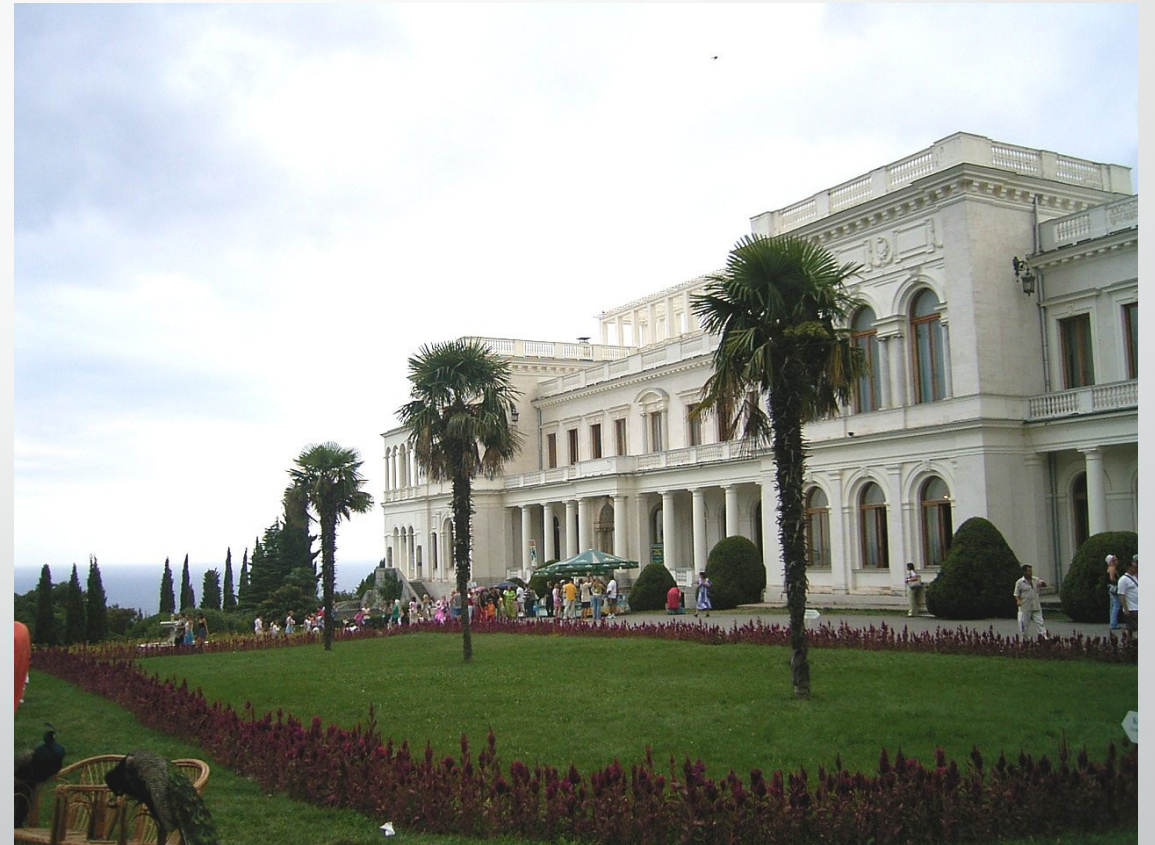
Livadijský palác v letovisku Jalta

Na jaře 1945 se v Livadijském paláci konala Jaltská konference , na níž se sešli budoucí vítězové války: Stalin, F. D. Roosevelt a W. Churchill.