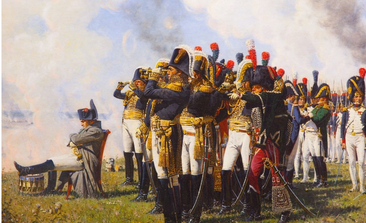
«Наполеон на Бородинских высотах», 1897

В данном случае, вероятно, не стоит отдельно говорить о совпадениях или использовании одинакового материала. Стоит отметить некоторые параллели в картине «Расстрел в Кремле» со сценой расстрела «поджигателей» в романе.