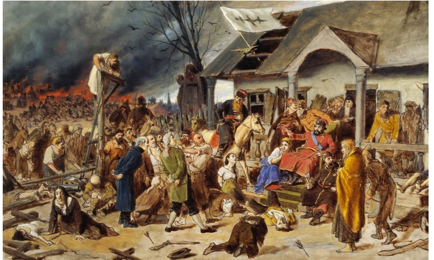
«Суд Пугачева», 1879

Вряд ли при работе над этой картиной художник ориентировался исключительно на повесть Пушкина. Однако нельзя ни отметить некоторую общность обоих произведений.