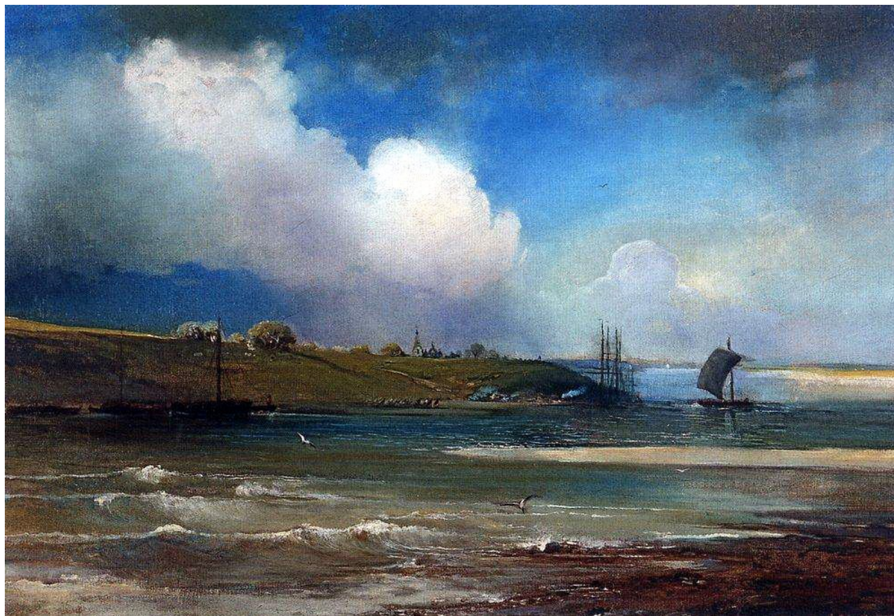
«Волга под Юрьевцем», 1870

В русской живописи 19 века есть картина, гораздо больше подходящая для иллюстрации этого стихотворения - «Волга под Юрьевцем» Алексея Саврасова. Здесь, как и в стихотворении Некрасова, основной упор делается на бесконечный волжский простор, частью которого стали бурлаки. Как и поэт, который смотрит на реку с высокого берега, Саврасов «дает» свой пейзаж с какой-то возвышенной точки. В этих произведениях еще есть совпадающие детали, так, Некрасов упоминает монастырь, и на картине Саврасова четко просматриваются купола городского собора.