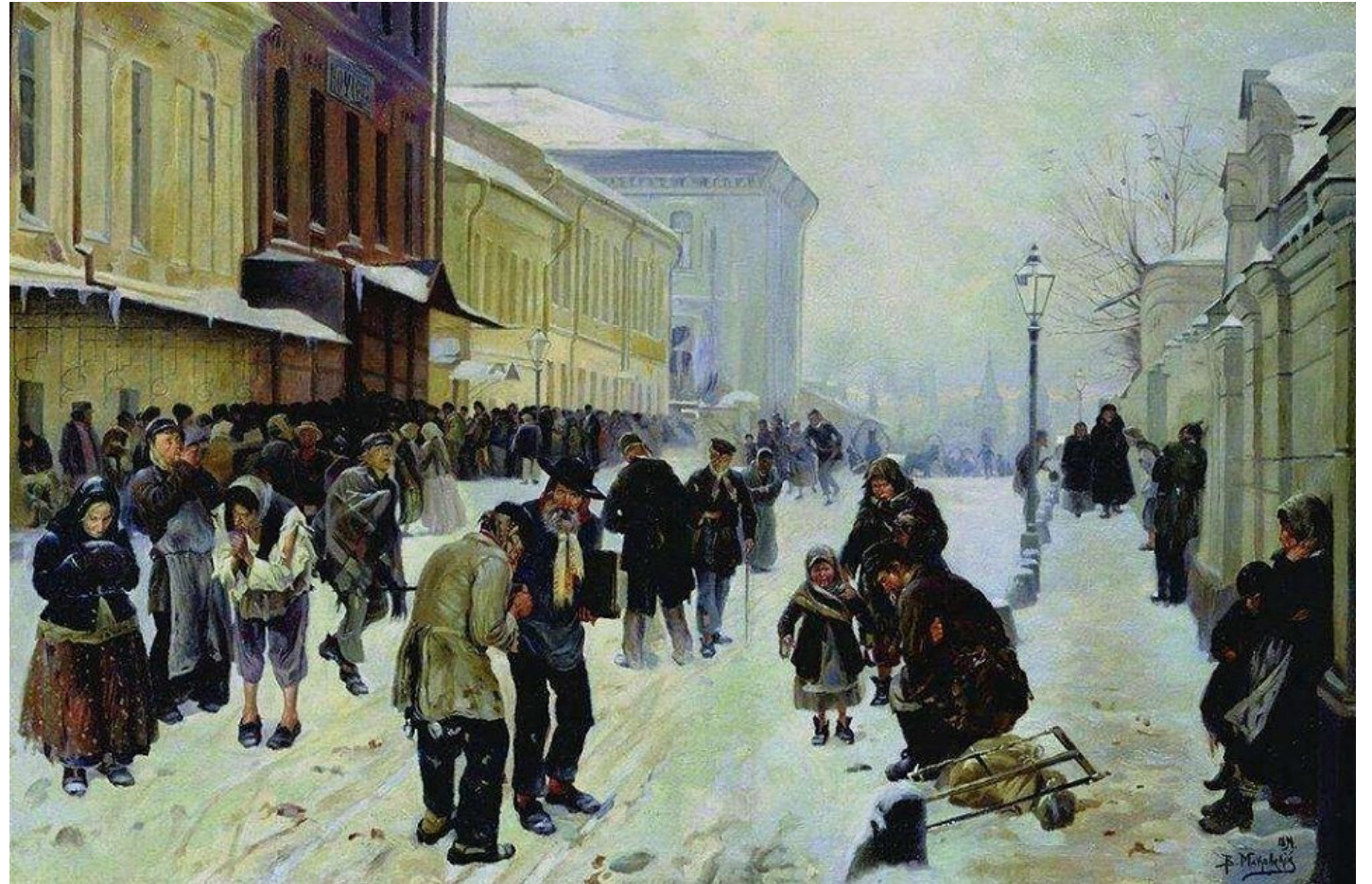
«Ночлежный дом», 1889

В этом случае тоже проблематично говорить о прямой связи двух произведений, но в персонажах картины легко просматриваются некоторые герои драмы: Сатин - старик с фолиантом, Клещ - бывший мастерской.