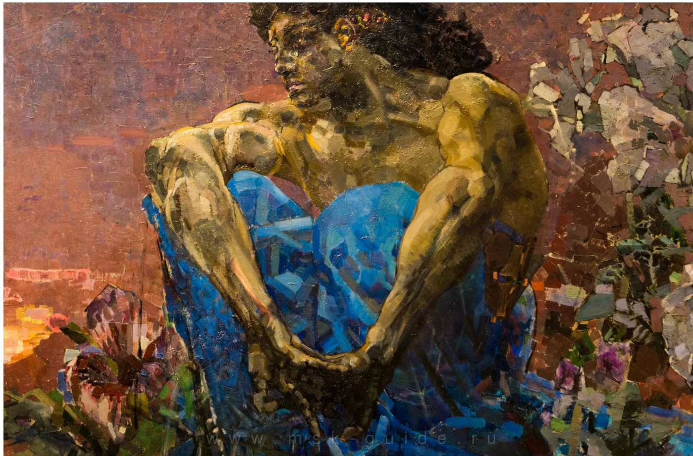
«Демон сидящий», 1890

Для обоих авторов характерно восприятие Демона как воплощения творческого начала в душе художника.