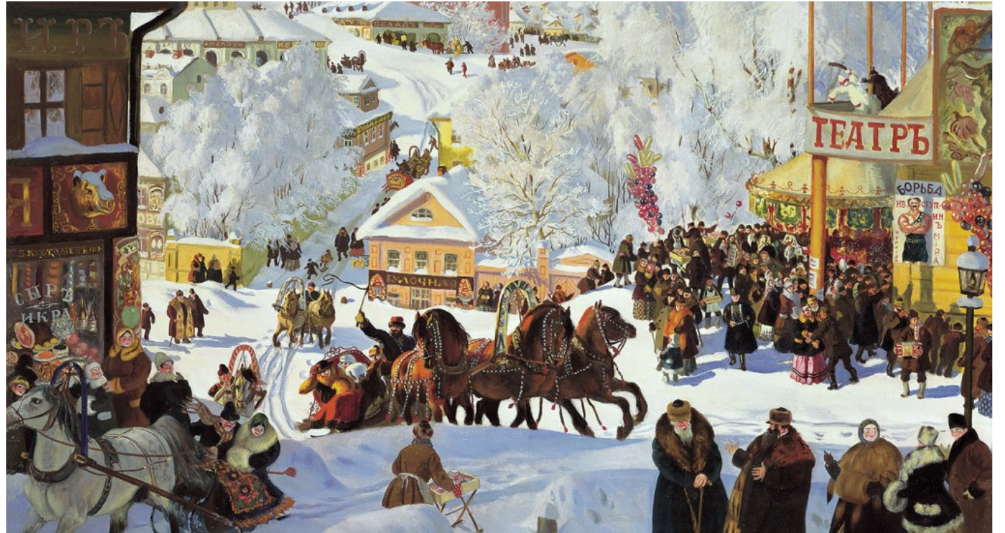
«Зима. Масленица», 1916

В обоих произведениях чувствуется тоска по той добродушной хлебосольной России.