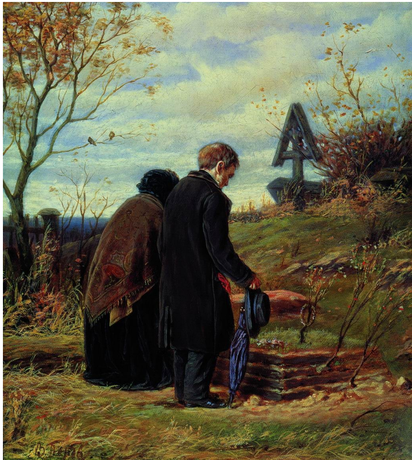
«Старики родители на могиле сына», 1870

Эта картина является обязательной иллюстрацией романа Тургенева, хотя однозначно не доказано, что художник использовал конкретно этот сюжет.