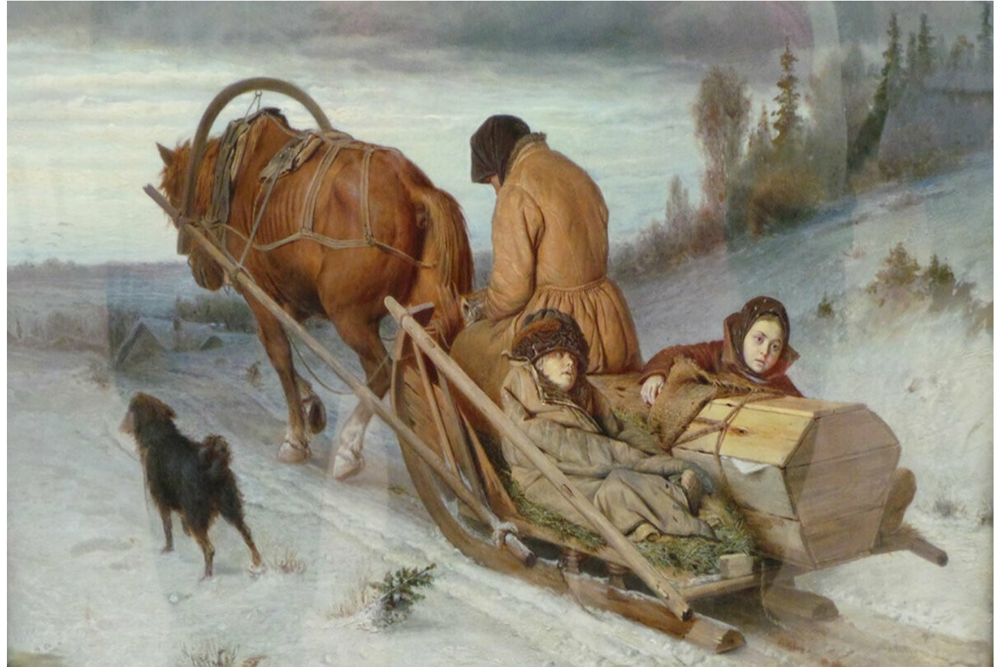
«Проводы покойника», 1864

Хотя эта картина часто используется для иллюстрации поэмы, вероятнее всего художник и поэт размышляли на одинаковую тему - сложный душевный мир «маленького человека».