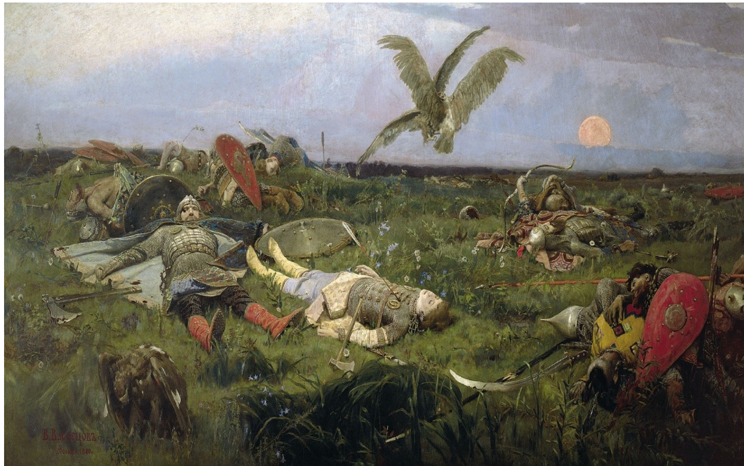
«После побоища Игоря Святославича с половцами», 1880

1) Полноценная разработка художником литературного материала, например, картина В. Васнецова «После побоища Игоря Святославича с половцами» по сюжету «Слова о полку Игореве».