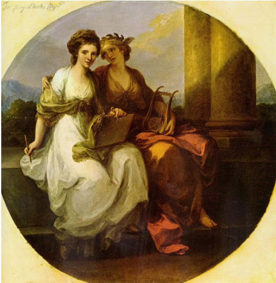
Ангелика М. Кауфман «Поэзия обнимает Живопись», 1782 году

Связь живописи с литературой не ограничивается жанром иллюстрации. Многие художники в своем творчестве использовали сюжеты известных литературных произведений или вдохновлялись похожими жизненными ситуациями, в результате чего появлялись вполне самостоятельные полотна, в то время как даже очень талантливая иллюстрация всегда вторична. Так и литература, и живопись являются абсолютно самостоятельными видами искусства, поэтому их взаимодействие в большинстве случаев нельзя свести только к «использовал готовую идею», чаще всего необходимо найти точки соприкосновения двух произведений.