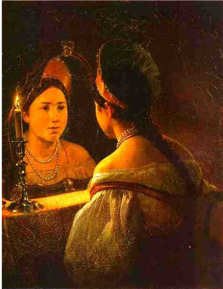
«Гадающая Светлана», 1836

Хотя название картины дает прямую отсылку к балладе Жуковского, Брюллов основной акцент сделал на психологическом портрете героини, которая «молчалива и грустна».