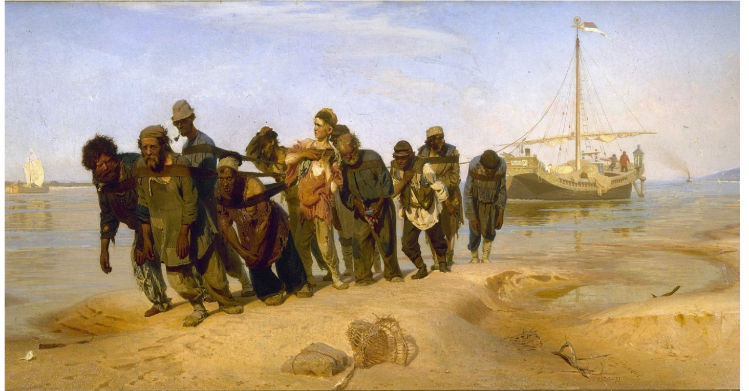
«Бурлаки на Волге», 1870 - 1873

Иногда складываются ошибочные впечатления о взаимосвязи литературного произведения и картины. Самый известный пример этого — иллюстрирование стихотворения Н. Некрасова «На Волге» картиной И. Репина «Бурлаки на Волге», что часто встречается в учениках литературы. Однако, в стихотворении основной упор делается на описании красот реки, её пейзажа, а встреча с бурлаками является одним из многих эпизодов. А полотно Репина является жанровой картиной, где пейзаж всего лишь фон для действия, что никак не соответствует стихотворению.