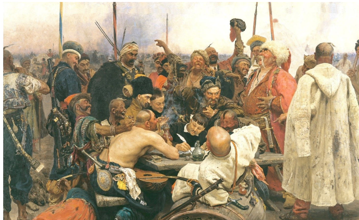
«Запорожцы, сочиняющие письмо турецкому султану», 1880-1891

Как и в предыдущей паре, эти произведения вряд ли связаны напрямую, однако их роднит общий образ Запорожской Сечи, с её «бешеным разгульем веселости».