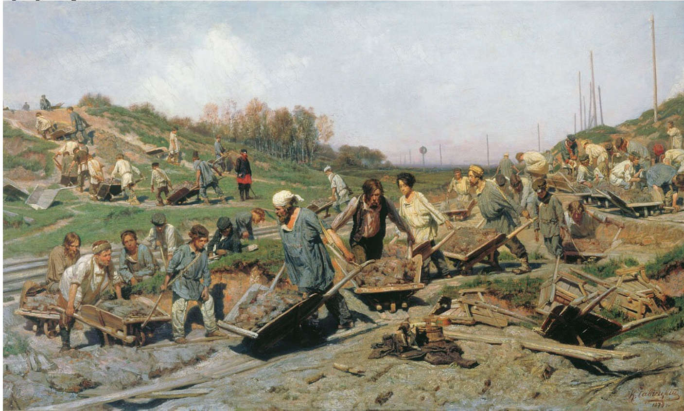
«Ремонтные работы на железной дороге», 1874

Как и в предыдущей паре, здесь не стоит говорить о прямом использовании сюжета стихотворения художником. Образ железной дороги, как бездушного прогресса, который перемалывает людские судьбы, всегда волновал деятелей искусства. Но, именно в произведениях Савицкого и Некрасова, несмотря на их серьезные различия, проскальзывают общие параллели.