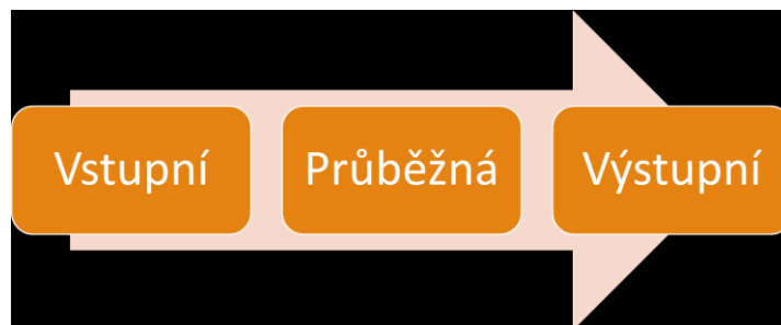
Členění diagnostiky – různá kritéria: podle časového sledu.