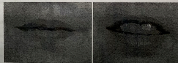
Obrázek: Faciální obrazy hlásek F-V (vlevo) a D-T-N-Ď-Ť-Ň (vpravo)

Zatímco pomocí sluchu lze většinou velmi přesně analyzovat a následně vyhodnotit zachycené fonémy a jednotlivé hlásky lidské řeči, vizuální vnímání jejich faciálních obrazů (kinémů) je výrazně omezeno vzájemnou podobností jednotlivých kinémů. Pro všechny české hlásky je v literatuře (srov. Krauhulcová, 2001) uváděno pouze jedenáct kinémů (čtyři pro samohlásky a sedm pro souhlásky), z čehož vyplývá, že několik různých fonémů má jeden společný kiném (např. p-b-m, nebo f-v). Zatímco izolované samohlásky je možné z jejich podstaty odezírat poměrně jednoduše a přesně, ze souhlásek je možné zrakem přesně diferencovat pouze asi třetinu.