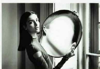
Duane Michals, Magic mirror of uncertainty