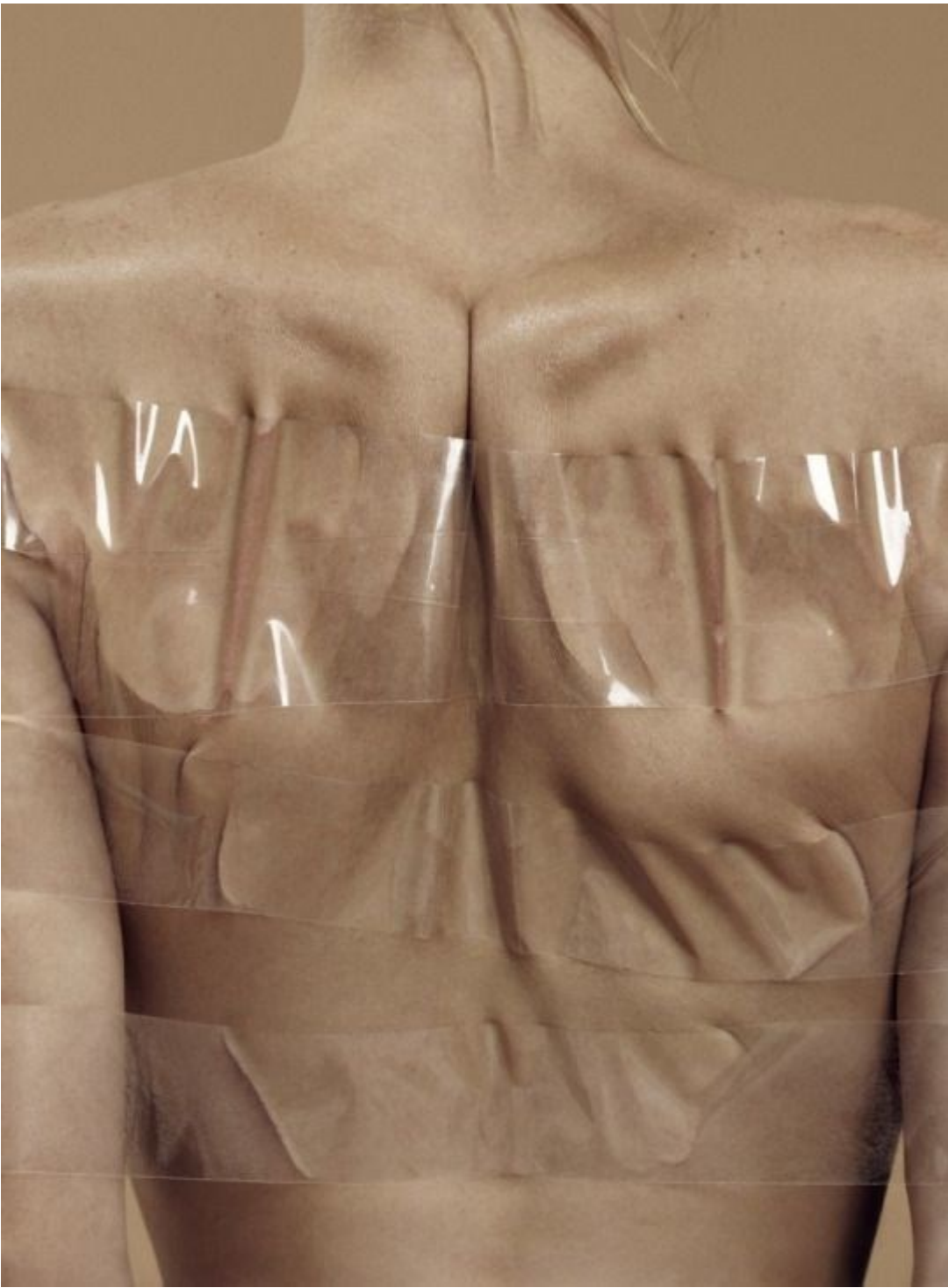
Chloe Ockrim, Second Skin