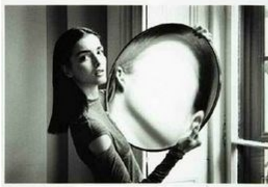
Duane Michals, Magic mirror of uncertainty