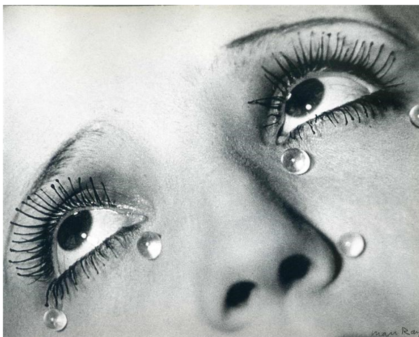
Man Ray, Glass Tears