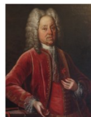
František Antonín hrabě Špork