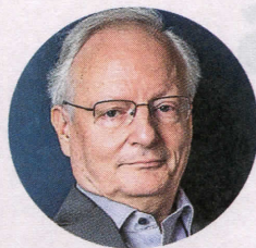
ANTOINE MARÈS francouzský historik, autor biografie o Benešovi

Když to v roce 1935 česká politika začala chápat, bylo už pozdě. Je ovšem otázka, jestli by nám v rozhodné chvíli Británie přece jen nepřišla na pomoc, kdyby byla v československých politických elitách dostatečná vůle k odporu. V národě tato vůle byla. Od té doby, co je známo, že generál německého generálního štábu Ludwig Beck pro případ, že Hitler Československo napadne, připravoval puč k jeho odstranění a mnichovská dohoda jej překazila, je namísto otázky, jestli by projevená vůle k odporu a odmítnutí Mnichova k napadení Československa nakonec vedla, a díky nekompromisnímu odhodlání malého národa se situace v Evropě nevyvinula jinak. Cena našeho odhodlání mohla být v případě konfliktu vysoká. Ale vyšší než důsledky Mnichova a protektorátu – půl milionu mrtvých Čechů, Slováků, Židů a padlých sudetských Němců – by sotva byla. Hluboké morální důsledky frustrace politiky elitami zmařené vůle národa k odporu si v sobě neseme dodnes. A v tom promě existuje i paralela mezi Mnichovem 1938 a normalizací jako následkem 21. srpna 1968 v selhání politikých elit.