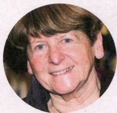
ALENA WAGNEROVÁ česko-německá spisovatelka

„Bránit jsme se měli“ bylo skoro jednoznačné mínění v mé generaci lidí narozených ve třicátých letech, když jsme v šedesátých letech jako mladí intelektuálové o tomto tématu diskutovali. „Pak bychom byli nestěhovali sudetské Němce“ se k tomu často ozvalo. Pro nás, v roce 1938 malé děti, bylo ovšem snadné to říkat, protože jsme za Mnichov nenesli odpovědnost. Dnes ale nemohu vynechat historický kontext události: Československá vláda zcela opomenula světovou hospodářskou krizí těžce postižené pohraničí přednostně podporovat a tak posílit loajalitu německého obyvatelstva ke státu. Nechala ve štychu aktivistické a antifašistické síly v sudetoněmecké společnosti a usnadnila tím Henleinovi její proměnu v zálohu Hitlerových mocenských plánů.