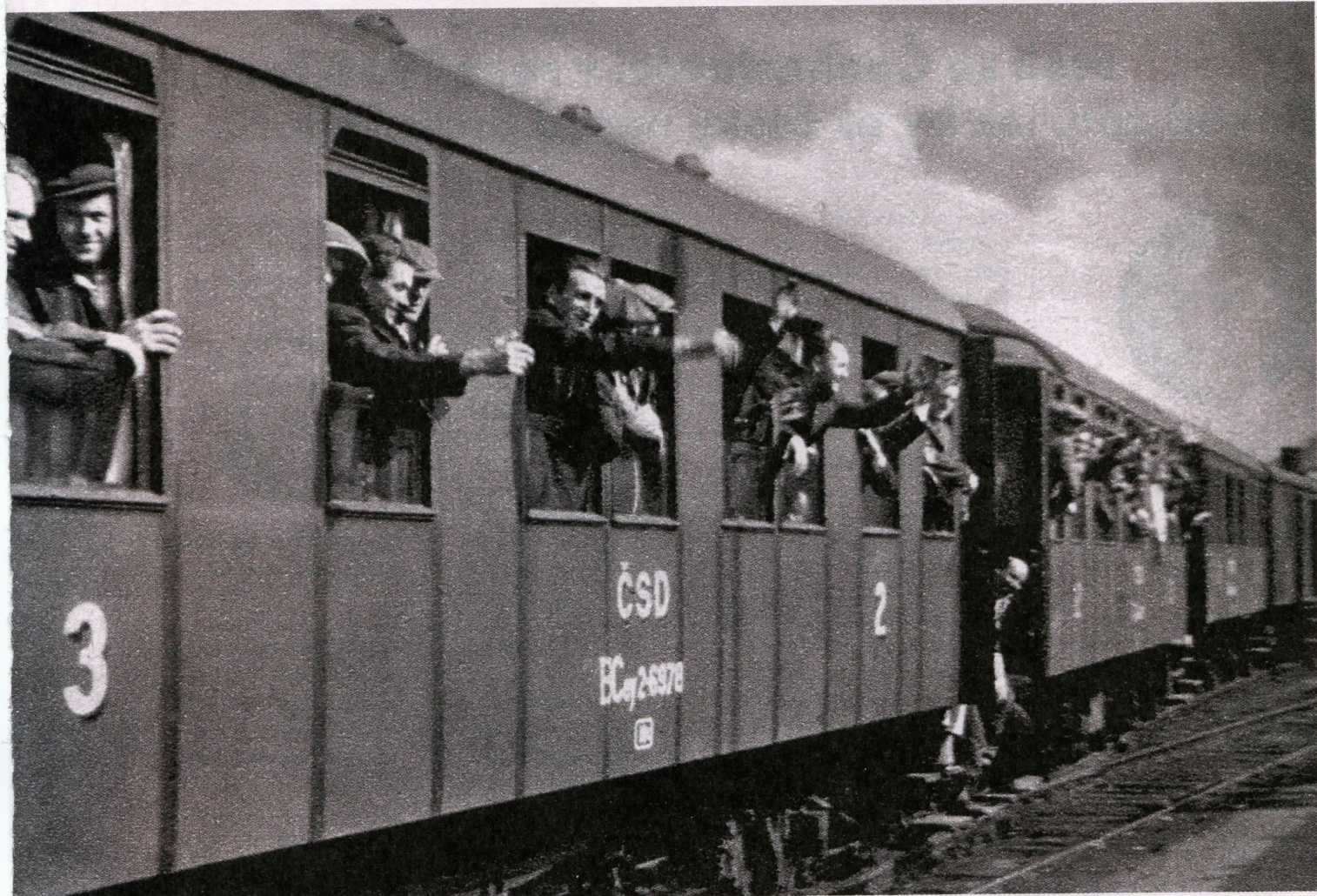
Než přišla kapitulace svědomí. (Záložníci odjíždějí po vyhlášení mobilizace ke svým bojovým útvarům)

rách – stále doufá, že se spojenci vrátí ke svým slibům a přijdou na pomoc.