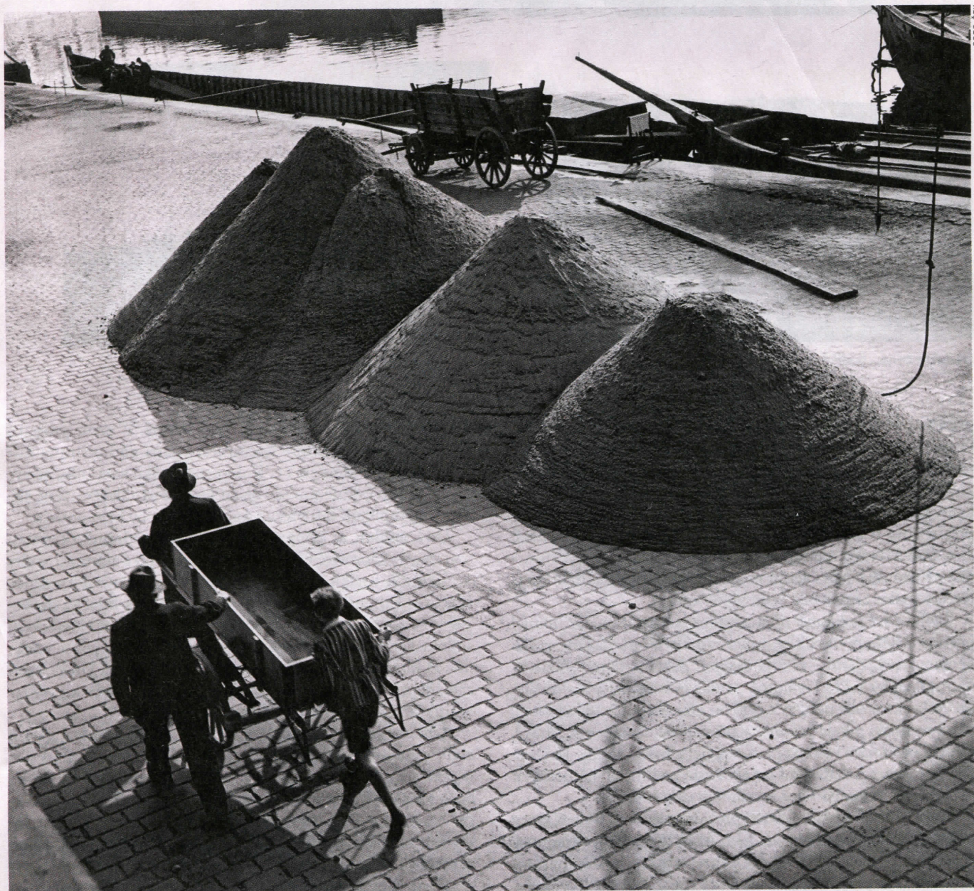
Proti bombardérům. (Písek připravený při mobilizaci pro hašení náletů na Prahu)

I. armáda se tedy podle plánu rychle stahuje do Povltaví, kde obsazuje připravené malé pevnůstky a umožňuje tak Praze