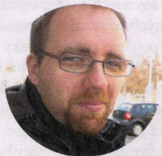
THOMAS OELLERMANN německý historik

neše k závěru podvolit se rozhodnutí mocností a následně okupaci Německem. Na druhé straně bylo dost faktorů, které dávaly naději alespoň na částečný úspěch, minimálně na oddálení konfliktu a získání času pro změnu stanoviska mocností, i když by Československo zřejmě označily za příčinu konfliktu. Úspěšně zvládnutá a rychlá všeobecná mobilizace, zásah armády proti Henleinovským bojůvkám v pohraničí, existence aktualizovaného plánu obrany státu, jednoznačný postoj hlavního štábu a vůle obyvatelstva bránit se, mnoho použitelných opevnění, kvalita výzbroje československé armády, nezanedbatelná opozice proti mnichovské dohodě v Británii i Francii, to vše mohlo politickému vedení nahrát k rozhodnutí postavit se zlu a bezpráví. Jako voják se ztotožňuji s názorem tehdejšího náčelníka hlavního štábu branné moci generála Ludvíka Krejčího a mé doporučení prezidentu republiky by bylo stejné – bránit se.