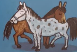
Die Pferde schlafen auf der Weide.