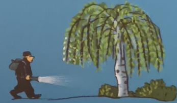
Was hat dieser Mann wohl vor?