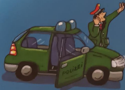
Mit wem telefoniert Hugo?