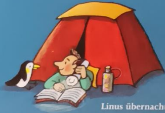
Linus übernachtet heute im Garten.