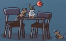
Die Mäuse haben die Krümel auf dem Tisch entdeckt.