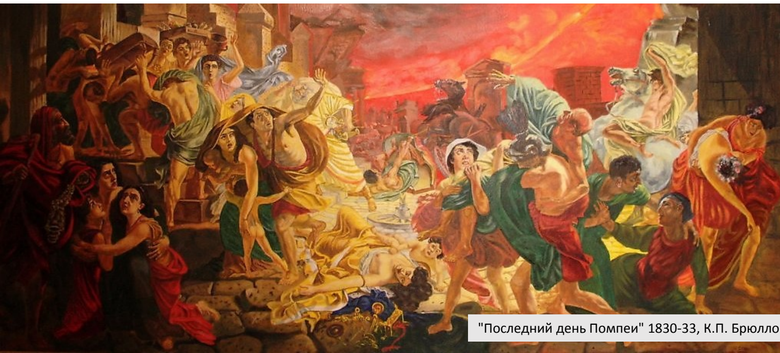
"Последний день Помпеи" 1830-33, К.П. Брюллов