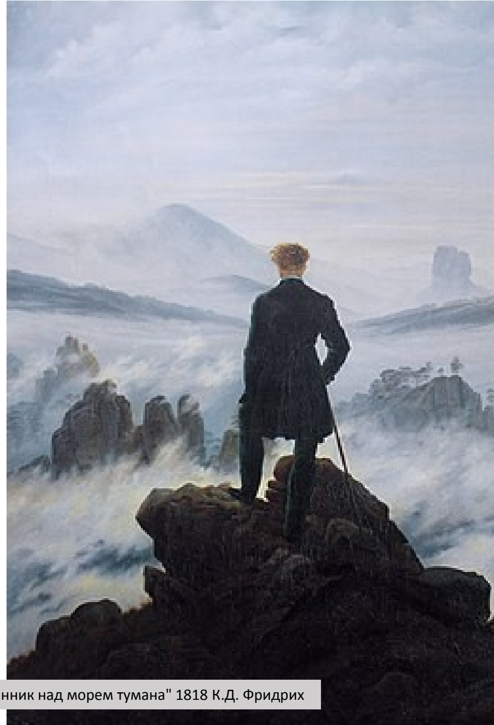
"Странник над морем тумана" 1818 К.Д. Фридрих

Англия У.Вордсворд, С.Кольридж, Р.Саути Дж.Г. Байрон, П.-Б. Шелли, Дж. Китс У. Блейк