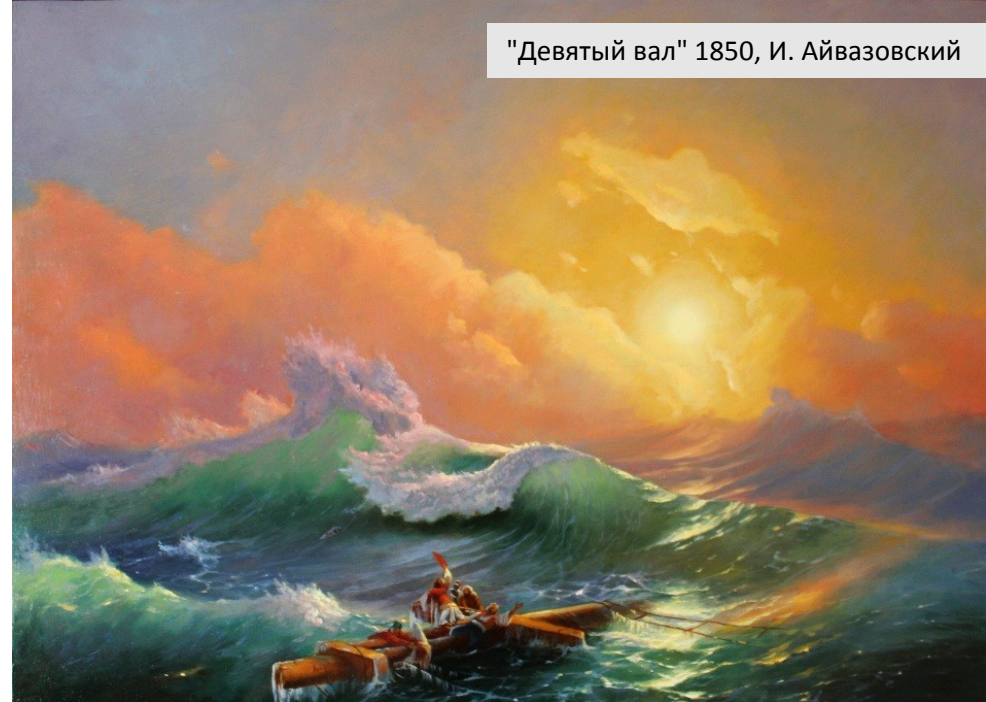
"Девятый вал" 1850, И. Айвазовский