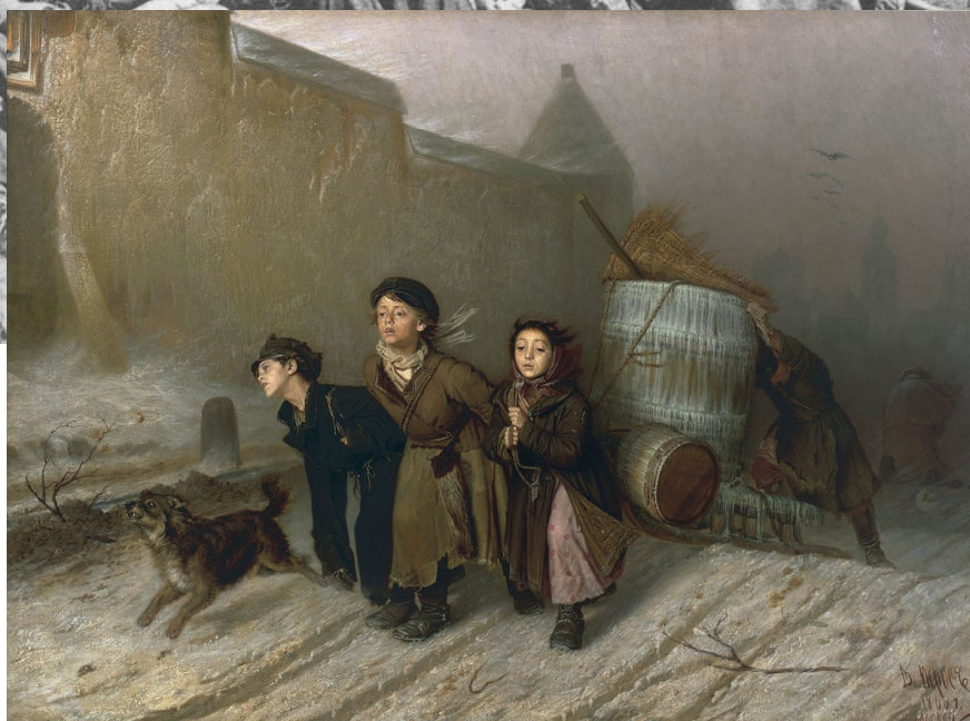
Василий Перов, «Тройка» (1866)