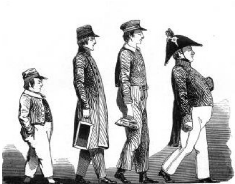
«Петербургские типы» Гравюра из сборника «Физиология Петербурга»