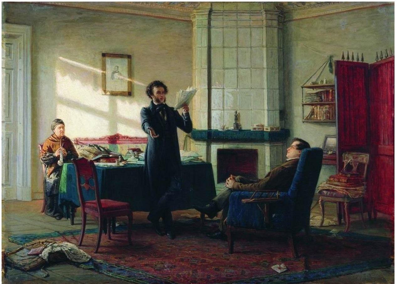
Николай Ге. «Пушкин в селе Михайловском» (1875)

В ноябре 1825 года Пушкин заканчивает трагедию «Борис Годунов» , посвященную событиям Смутного времени, главной в которой является проблема отношений царя, боярства и народа. Тема трагедии – приход к власти путем преступления – злободневно прозвучала в современной Пушкину России. Писатель стремился постичь прошлое, объяснить его и в то же время говорил о современности. В Михайловском написаны знаменитые стихотворения Пушкина: «К морю» , «Я помню чудное мгновенье» , «19 октября» , «Пророк» , поэму «Граф Нулин» , «Песни о Сеньке Разине» , центральные главы «Евгения Онегина» , В Михайловском Пушкина навестили друзья – Пущин и Дельвиг, здесь же Пушкин узнал о восстании в Петербурге 14 декабря 1825 года.