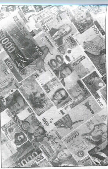
Деньги, деньги, деньги...

Бизнес выполняет и благотворительную функцию, оказывая финансовую поддержку социальным институтам, проектам в сфере науки, образования, культуры. Однако порой частным предприятиям необходимы деньги для расширения деятельности, наладки работы текущего финансового положения. В таком случае бизнес прибегает к услугам банков, которые предлагают специальные кредиты. Согласно последним исследованиям на сегодняшний день более 80% банков в России разрабатывали программы кредитования малого и среднего бизнеса.