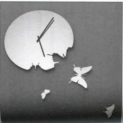
Часы в подарок – к несчастью

страну, культуру которой отличатся от традиций вашей, заранее запаситесь полной информацией о жестах, суевериях, приметах и обо всём, что могло бы стать причиной неприятного недоразумения.