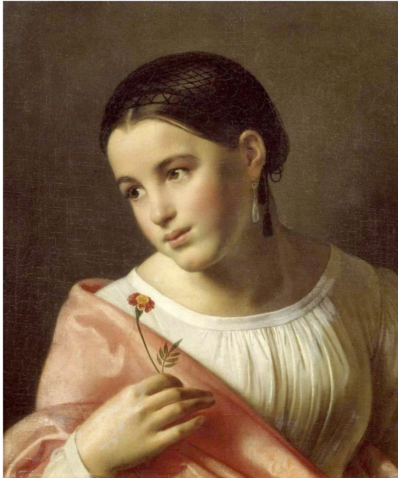
«Бедная Лиза», 1827

Название «Бедная Лиза» действительно отсылает к повести Карамзина. К тому времени, когда был написан портрет, интерес к этому произведению уже поутих, однако художник посчитал нужным напомнить публике о трагической судьбе девушки. Есть версия, что эта картина была данью памяти Карамзину, ушедшему из жизни в 1826 г.