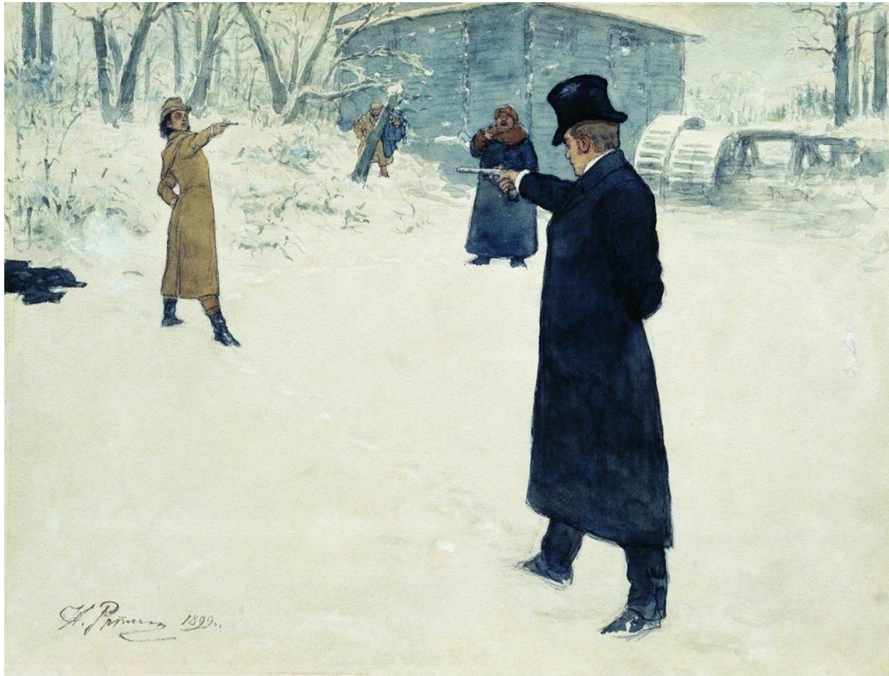
«Дуэль Онегина и Ленского», 1899

Несмотря на использование литературного материала, что становится понятно из названия картины, Репину удалось выйти из рамок иллюстрации и создать самостоятельное произведение. При помощи обычных изобразительных средств он сумел передать психологическую характеристику героев.