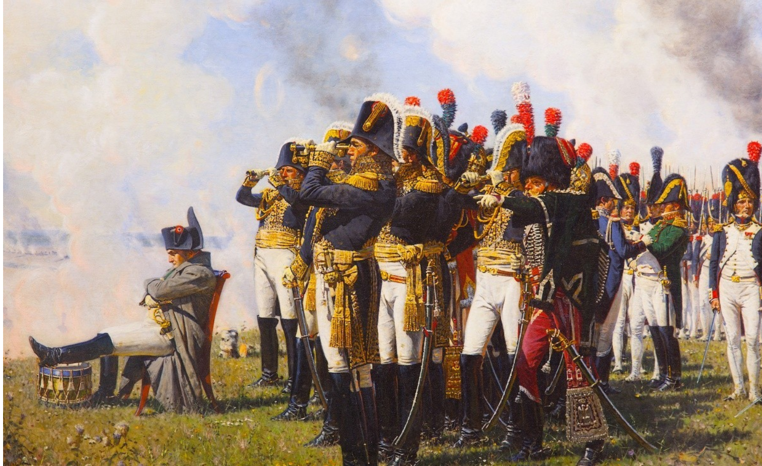
«Наполеон на Бородинских высотах», 1897

В данном случае, вероятно, не стоит отдельно говорить о совпадениях или использовании одинакового материала. Стоит отметить некоторые параллели в картине «Расстрел в Кремле» со сценой расстрела «поджигателей» в романе.