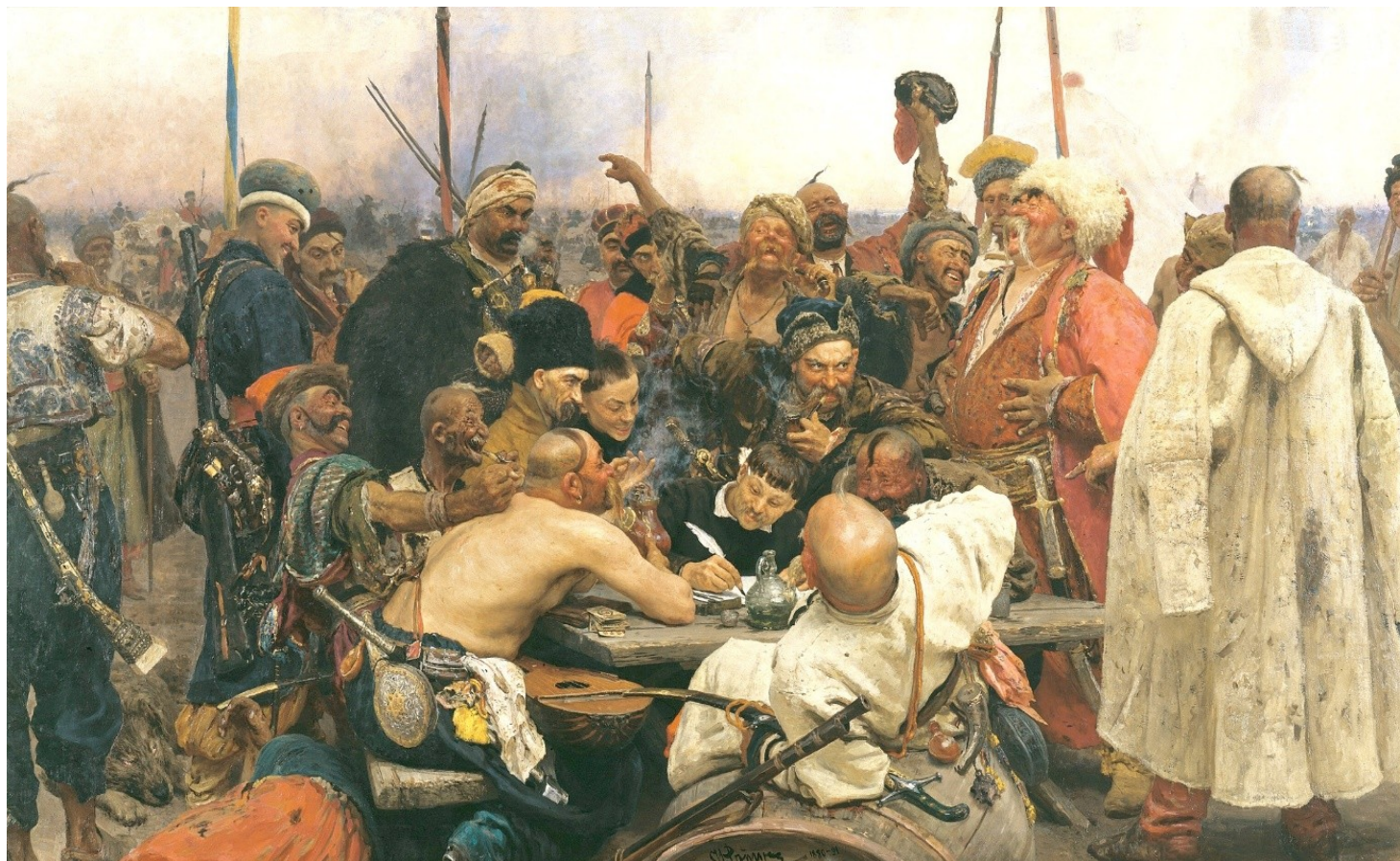
«Запорожцы, сочиняющие письмо турецкому султану», 1880-1891

Как и в предыдущей паре, эти произведения вряд ли связаны напрямую, однако их роднит общий образ Запорожской Сечи, с её «бешеным разгульем веселости».