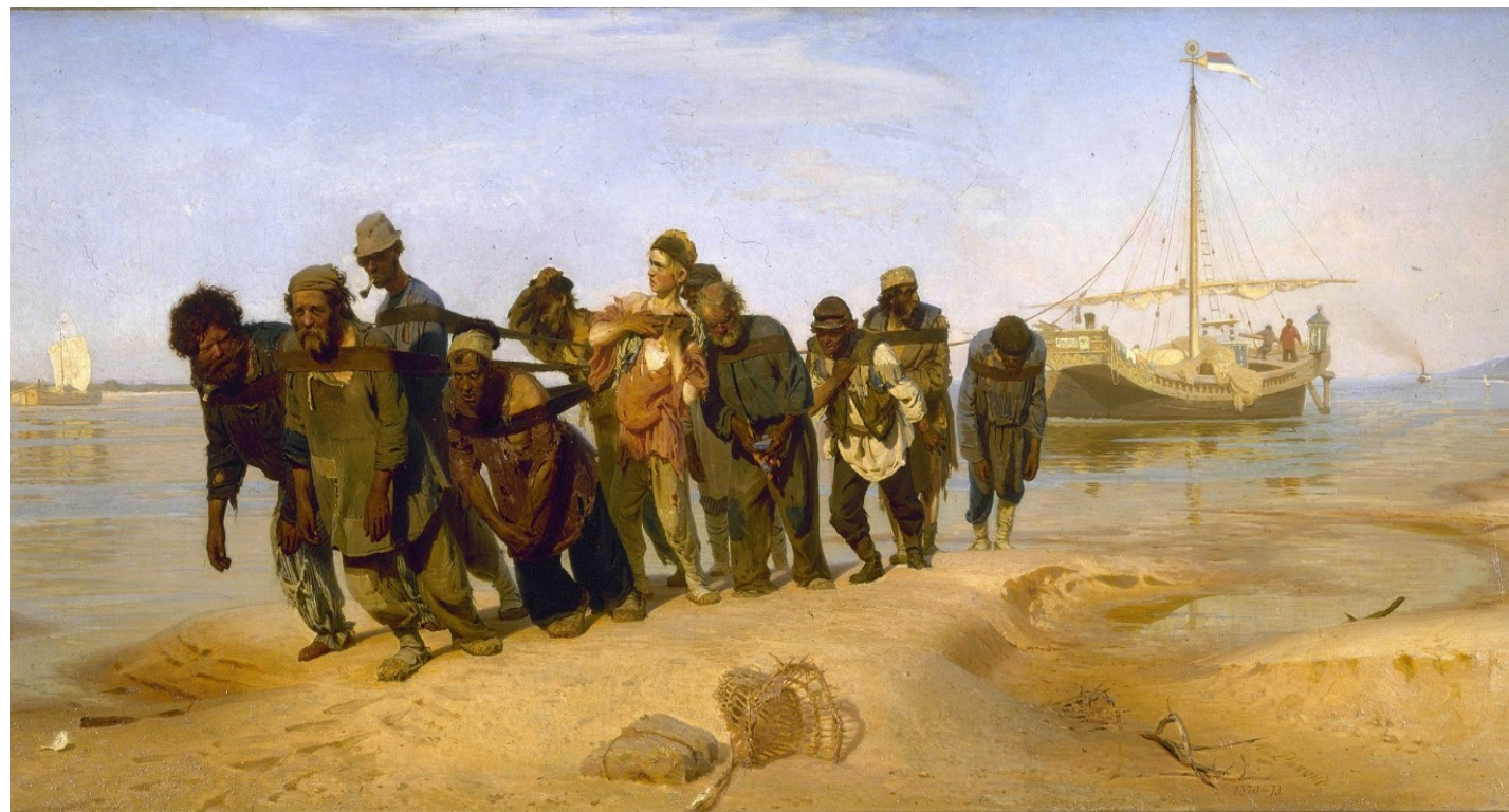
«Бурлаки на Волге», 1870 - 1873

Иногда складываются ошибочные впечатления о взаимосвязи литературного произведения и картины. Самый известный пример этого — иллюстрирование стихотворения Н. Некрасова «На Волге» картиной И. Репина «Бурлаки на Волге», что часто встречается в учениках литературы. Однако, в стихотворении основной упор делается на описании красот реки, её пейзажа, а встреча с бурлаками является одним из многих эпизодов. А полотно Репина является жанровой картиной, где пейзаж всего лишь фон для действия, что никак не соответствует стихотворению.