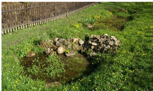
Tůňkou v zahradě uděláte radost nejen sobě a dětem, ale též nepřebornému množství živočichů, kteří tento vodní biotop obývají.