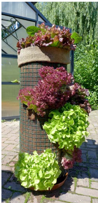
Okrasná i jedlá zelenina. Vertikální pěstování ušetří místo a také ochrání před plzáký.