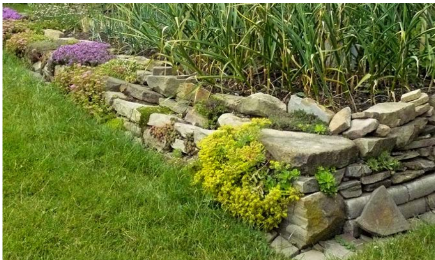
Kamenná zídka pro živočichy může být rozkvetlou součástí vaší zahrady.