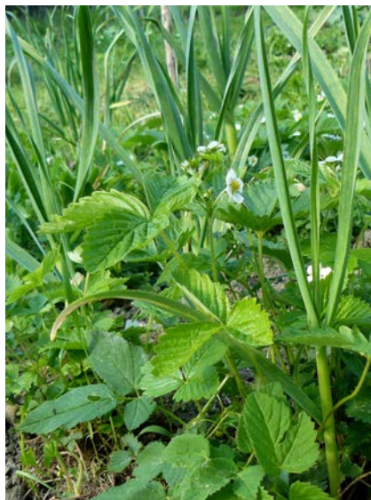
Pěstování česneku spolu s jahodami napomůže snížení plesnivosti jahod.