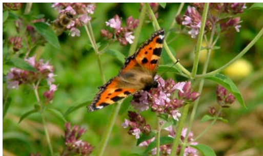
Nektarodárné květy na zahradě přilákají spoustu motýlů i jiného hmyzu.