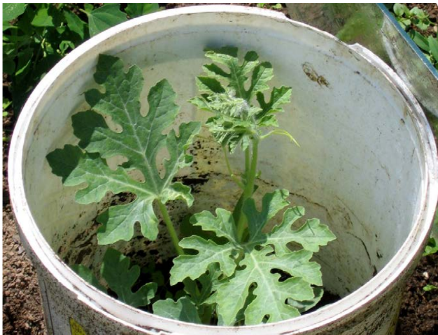
Ochrana melounů před pozdními mrazíky pomocí bezedného kyblíku. V případě nutnosti můžeme ještě zakrýt sklem.