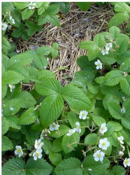
Nastýlka slámy pod rostlinami udrží půdu vlhkou a kyprou a jahody čisté.