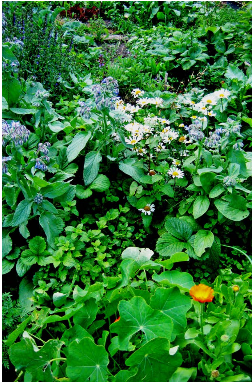
Rostliny pro chuť, zdraví i okrasu: měsíček, brtnák, meduňka, lichořeřišnice, ...