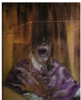
Francis Bacon, 1949 Hlava VI, 93x77cm