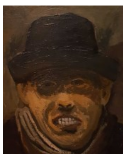
A. R. Penck Aoutoportrét s kloboukem,