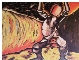
Enzo Cucchi, 1981/82 Hrdina bez tváře 203x255cm