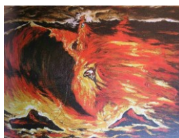
Enzo Cucchi, 1983 300x400cm