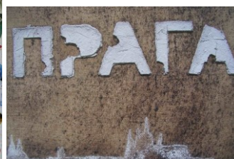
J. G. Dokoupil Výstava v Domě umění, 2005