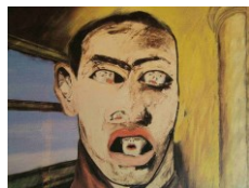
Francesco Clemente Bez názvu, 1983