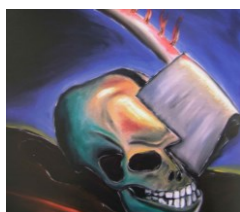
Jiří Georg Dokoupil Výřez z malby 600x338cm