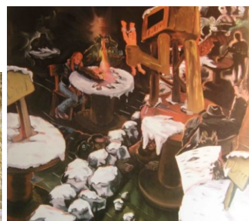
Jörg Immendorf, 1978 Schnee-Café Deutschland