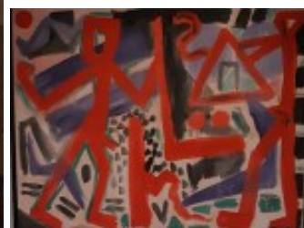
A. R. Penck, 1979 Konec na Východě 1958