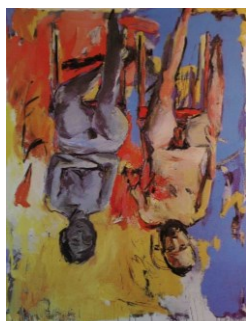
Georg Baselitz, 1975 Rodinný portrét