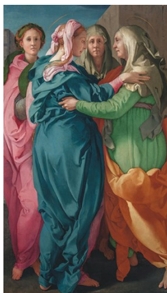
Bill Viola: The Greeting 1995 (Visitazione 1528 – Carmignano di Pontormo)