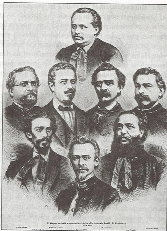
Čestní novináři 60. a 70. let (mj. Neruda, Hálek, Sabina)

ním šířením. Upozorňoval také na vážné nedostatky v literárním vzdělávání počínaje školou.