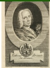
Matyáš Bernard Braun - sochař (1684 – 1738)