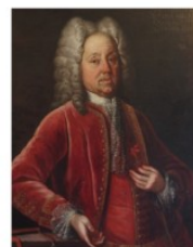
František Antonín hrabě Špork