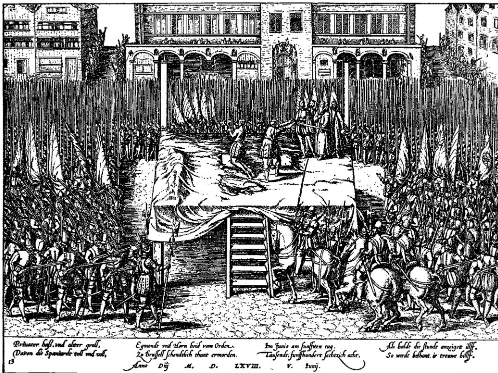
Hinrichtung der Grafen Egmont und Hornes auf dem Marktplatz zu Brüssel.

1569 – generálním stavům předložen návrh španělského daňového systému – tzv. alcabala , 1% z majetku, 5% z transakcí s ním, 10 % z jakéhokoli obchodu!!! Pod tlakem nucen odložit platnost, ale často realizováno.