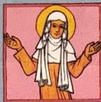
2. Svatá Ludmila

Atributy: stočený závoj nebo šál kolem hrdla (nástroj umučení), případně provaz, který někdy drží v ruce. Ojediněle má v ruce misku s hrozny nebo staroboleslavské paladium. Často je zobrazována s malým svatým Václavem, kterého vyučuje z knihy.