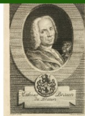
Matyáš Bernard Braun - sochař (1684 – 1738)