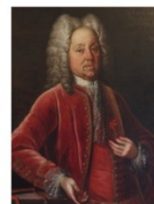
František Antonín hrabě Špork