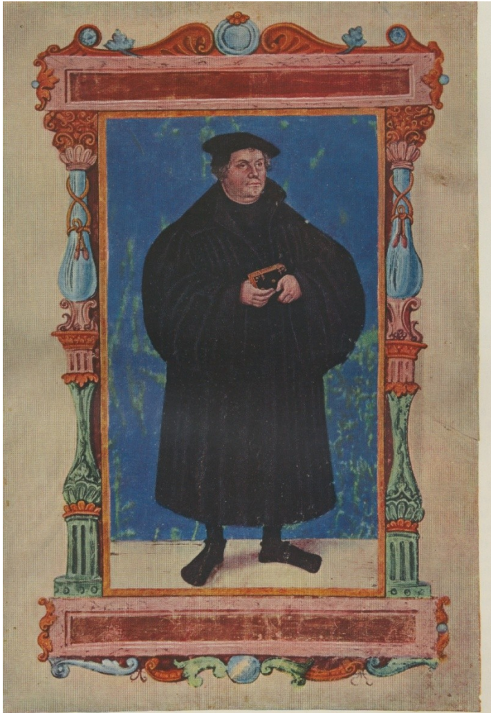
Martin Luther Farbige Zeichnung von Lucas Cranach dem Älteren (1472-1553) im königlichen Kupfer- stichkabinett zu Berlin