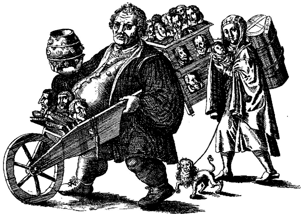
Spottbild auf Luther und Katharina von Bora. Original in der königlichen Bibliothek in Berlin.