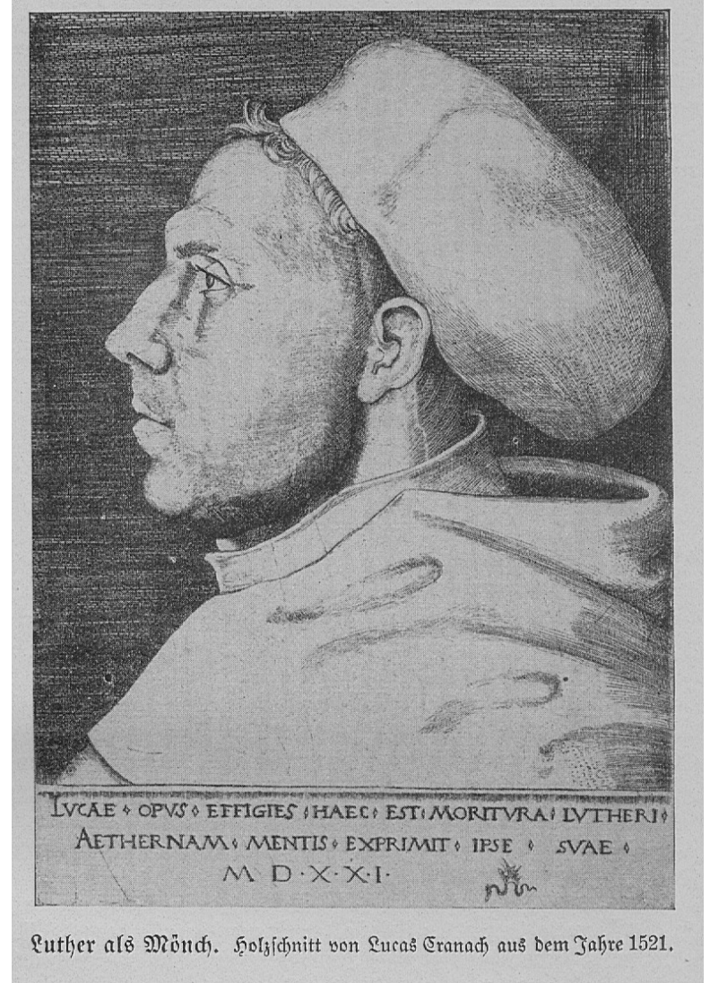
Luther als Mönch. Holzschnitt von Lucas Cranach aus dem Jahre 1521.