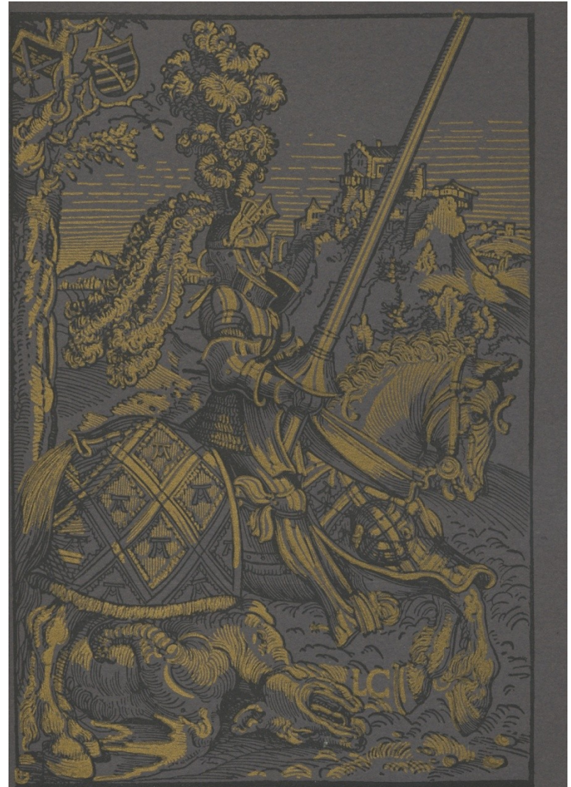
Der heilige Georg sprengt über den erschlagenen Drachen (Sinnbild des siegreichen Protestantismus über die Papstkirche)