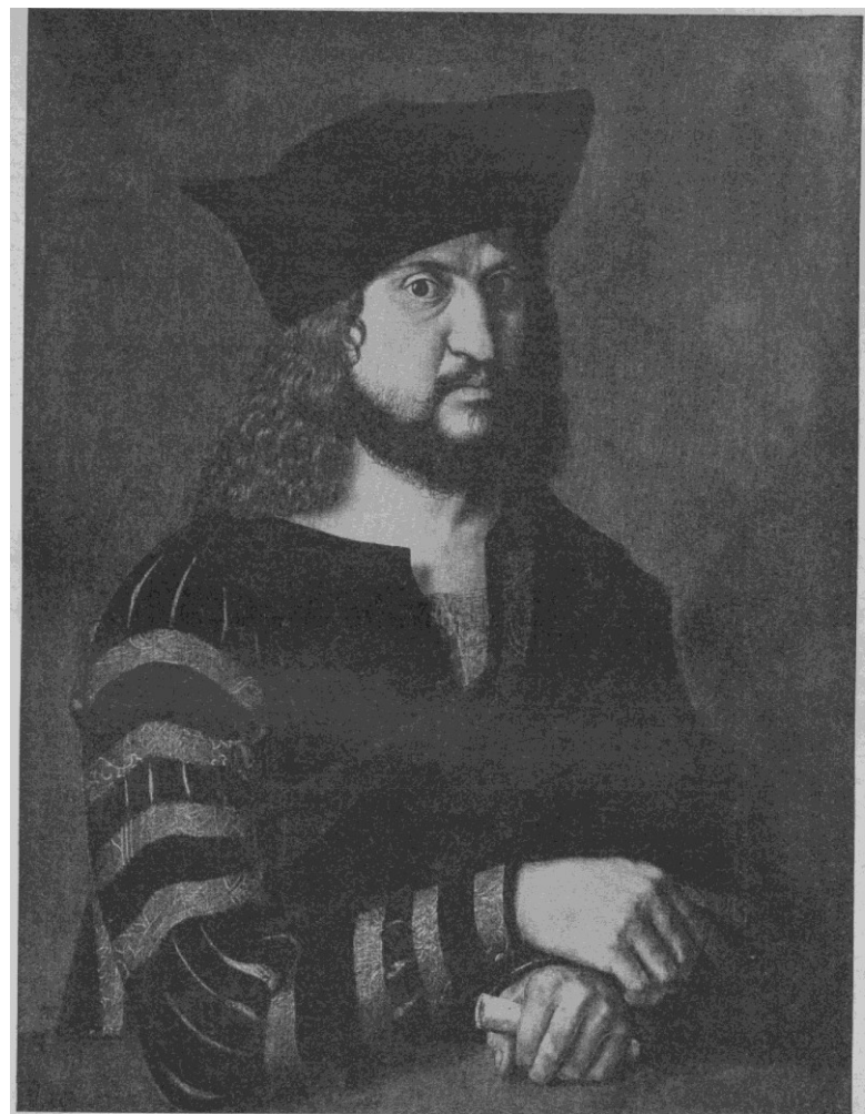
Kurfürst Friedrich der Weise von Sachsen. Gemälde von Albrecht Dürer im Kaiser-Friedrich- Museum zu Berlin.