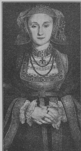
Catherine Parr. Gemälde in der National- Vorträt-Galerie zu London.