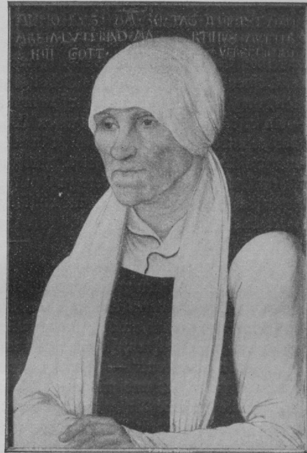
Gemälde von Lucas Cranach.