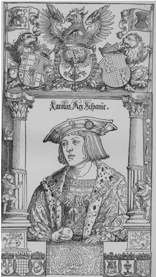
Kaiser Karl V.