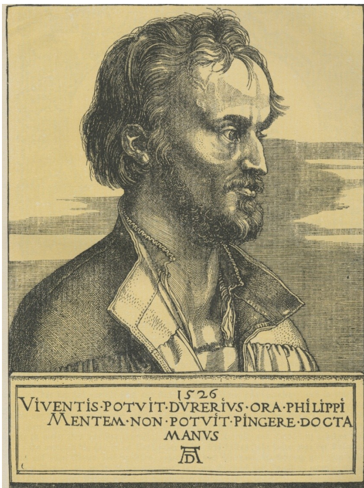
Philipp Melanchton. Kupferſtich von Albrecht Dürer aus dem Jahre 1526.