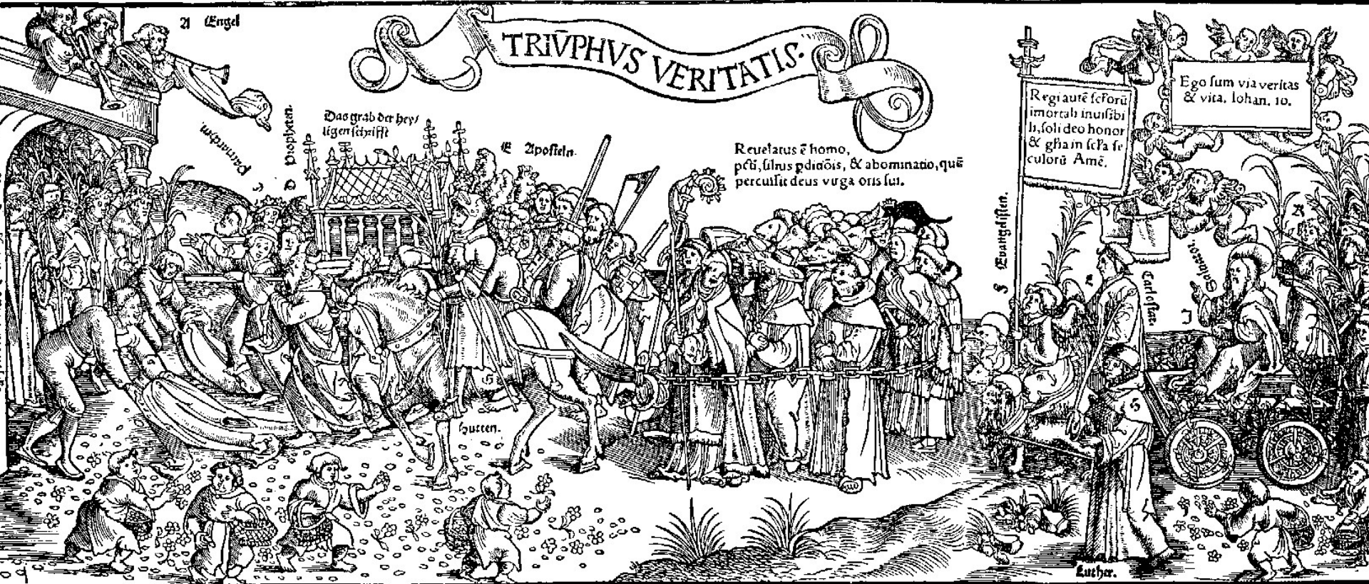
Rückseite des Titelblattes zum „Triumphus veritatis“ (Triumph der Wahrheit). Holzschnitt eines unbekannten Meisters aus der Zeit der Reformatio