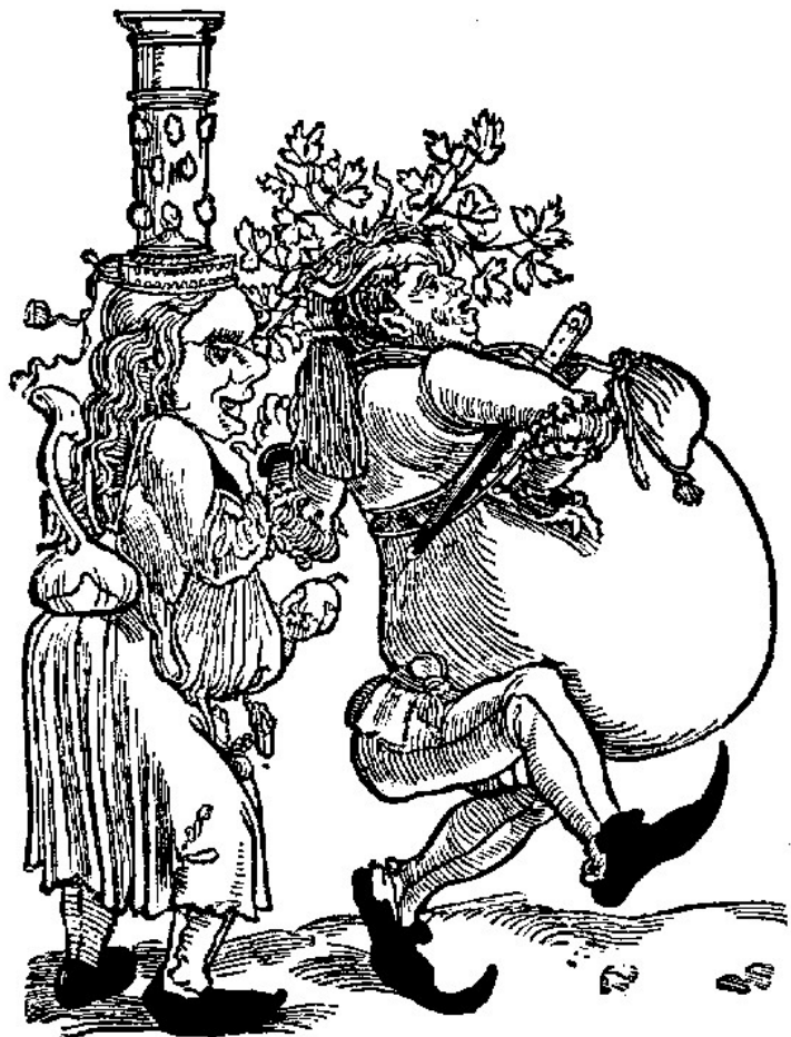
Zeitgenössische Karrikatur auf Luther und seine Frau.