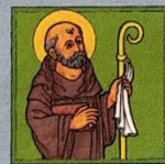
5. Svatý Prokop

Další atributy: oštěp nebo kopí či svazek šípů, někdy také orel, který podle legendy hlídal Vojtěchovo bezhlavé tělo.