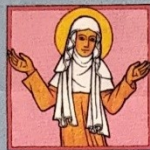
2. Svatá Ludmila

Atributy: stočený závoj nebo šál kolem hrdla (nástroj umučení), případně provaz, který někdy drží v ruce. Ojediněle má v ruce misku s hrozny nebo staroboleslavské paladium. Často je zobrazována s malým svatým Václavem, kterého vyučuje z knihy.