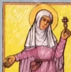
14. Svatá Zdislava

Metoděj - deska s obrazem posledního soudu a berla v podobě T nebo ukončená křížem, častěji dvojtypy.