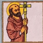
6. + 7. Svatí Cyril a Metoděj