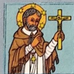
8. Svatý Jan Nepomucký

Atributy: ubožák u nohou a model kostela v ruce.