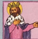
10. Svatý Zikmund