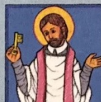
12. Svatý Jan Sarkander