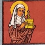
4. Svatá Anežka Česká