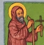
13. Svatý Ivan