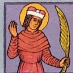
9. Svatý Vít