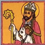
3. Svatý Vojtěch