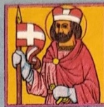
1. Svatý Václav

Další atributy: staroboleslavské paladium, dva andělé po stranách, klasy a hrozny.