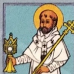
11. Svatý Norbert

Další atributy: mitra, berla, kříž, řídceji: laň, důtky, model kostela.