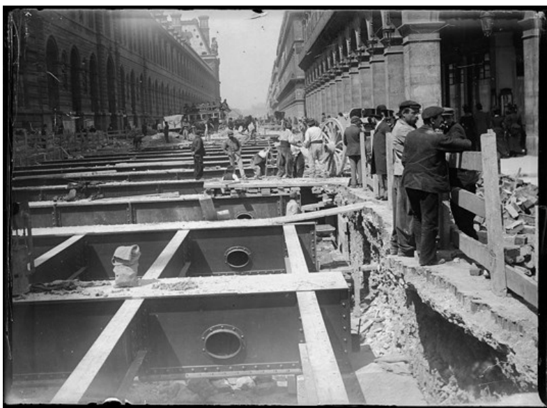
Travaux rue de Rivoli, mai 1899

Mais ces travaux, qui entraîneront de gigantesques bouleversements, attiseront également la colère des parisiens.