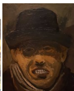
A. R. Penck Aoutoportrét s kloboukem,