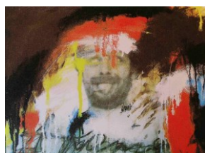
Arnulf Rainer, 1975 Jazyček bez vah