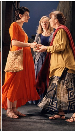
Bill Viola: The Greeting 1995 (Visitazione 1528 – Carmignano di Pontormo)