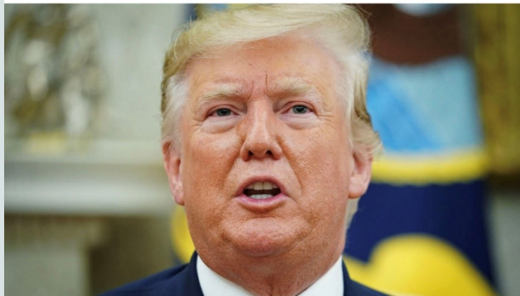
US President Donald Trump during a meeting with Romania's President Klaus Iohannis in the Oval Office of the White House in Washington, DC, on August 20, 2019.

Issued on: 20/08/2019 - 22:44 Modified: 20/08/2019 - 22:47