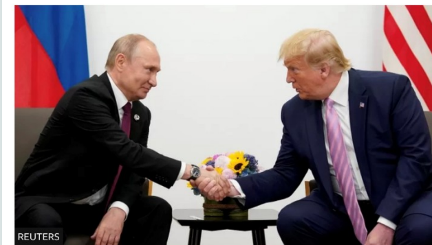
US President Donald Trump has previously supported Russia's return to the group

The UK and Canada have opposed Russia's return to the G7, deepening a rift over US President Donald Trump's wish for the country to rejoin.