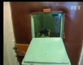
EL-MÁSRÍ V. "THE FORMER YUGOSLAV REPUBLIC OF MACEDONIA"