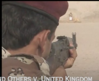
AL-SKEINI AND OTHERS V. UNITED KINGDOM