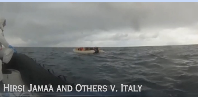
HIRSI JAMAA AND OTHERS V. ITALY