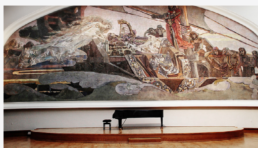
Зал Врубеля Третьяковской галереи

Во время фестиваля Vivarte будет звучать музыка европейских и русских композиторов. Во Врубелевском зале исполнят сочинения Иоганна Себастьяна Баха, Йозефа Гайдна, Сергея Рахманинова, Сергея Прокофьева, а главное — Эдварда Грига и других скандинавских авторов, многие из которых ранее не исполнялись в России.