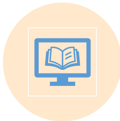
INDUKTIVNÍ VÝUKA (PROBLÉMOVÁ) – AUTENTICKÉ UČENÍ