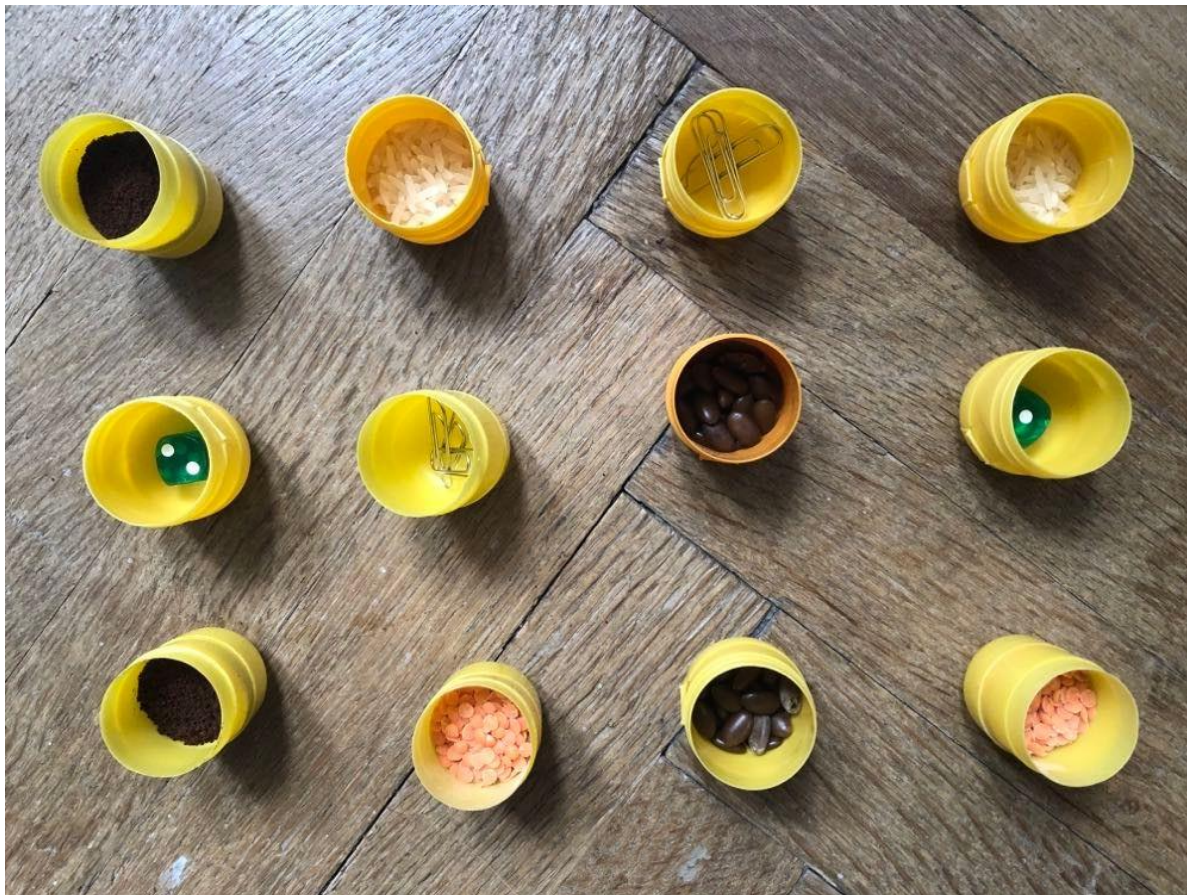
Obr. 2 Obsah vajčok