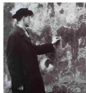
Vladimír Boudník (1924-1968) Explosionalismus, 1949