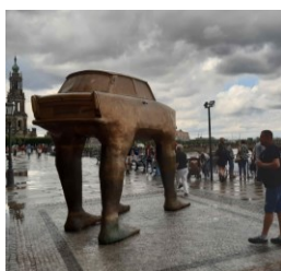
David Černý (1967) Quo vadis, 1990