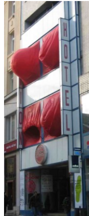
Dýchající dům Brno Art Open