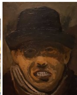
A. R. Penck Aoutoportrét s kloboukem,