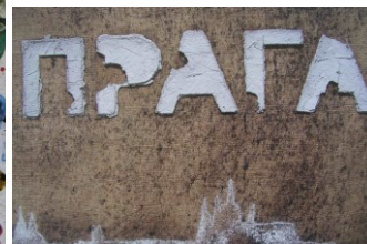
J. G. Dokoupil Výstava v Domě umění, 2005