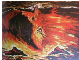
Enzo Cucchi, 1983 300x400cm