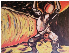
Enzo Cucchi, 1981/82 Hrdina bez tváře 203x255cm