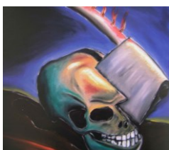
Jiří Georg Dokoupil