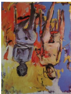
Georg Baselitz, 1975 Rodinný portrét