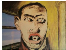
Francesco Clemente Bez názvu, 1983