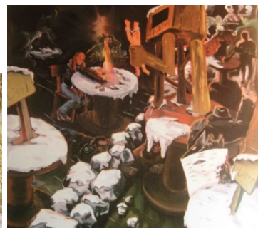
Jörg Immendorf, 1978 Schnee-Café Deutschland