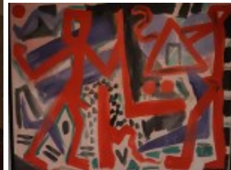
A. R. Penck, 1979 Konec na Východě 1958