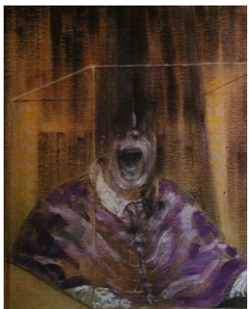
Francis Bacon, 1949 Hlava VI, 93x77cm