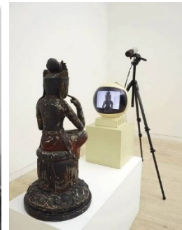
Nam Jun Paik: TV Buddha 1976