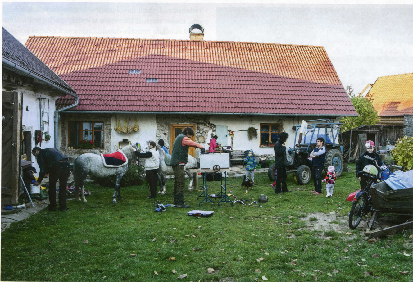
Důstojnost může být subjektivní, nezávislá na mzdě.

i z ekologického hlediska. Já myslím, že jestli se někdo cítí důstojně, nebo ne, je hodně subjektivní kategorie.“