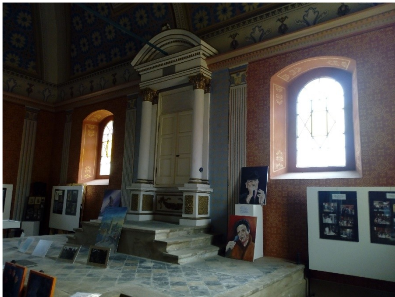
Súčasný interiér a výstava v synagóge v Strážnici; Foto: s. Lesňák, 2018