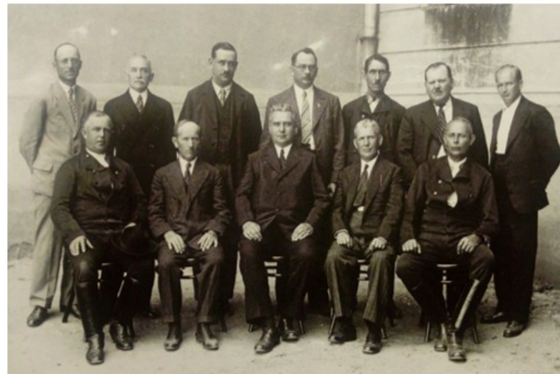
Mestká rada Strážnice, 1932, (Pajer, 2012, s. 78)