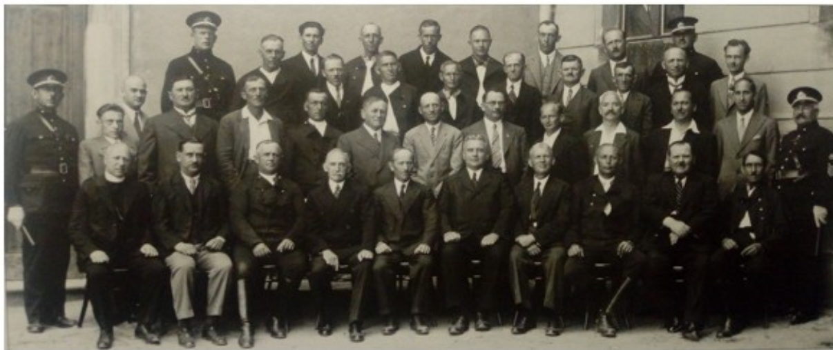
Mestké zastupiteľstvo Strážnice, 1932. (Pajer, 2012, s. 77)