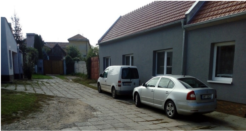
Súčasná podoba domu Felixových na Bzeneckej ulici, Strážnice 2018.