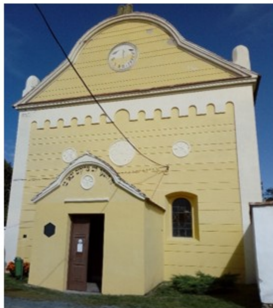
Zrekonštruovaná synagóga v Strážnici. Foto S. Lesňák, 2018; Hrob Heřmanna Felix v Strážnici, Židovský cintorín. Foto S. Lesňák, 2018