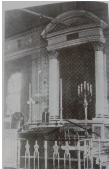
Interiér synagógy v Strážnici v roku 1910 (Pajer, 2002, s. 312)