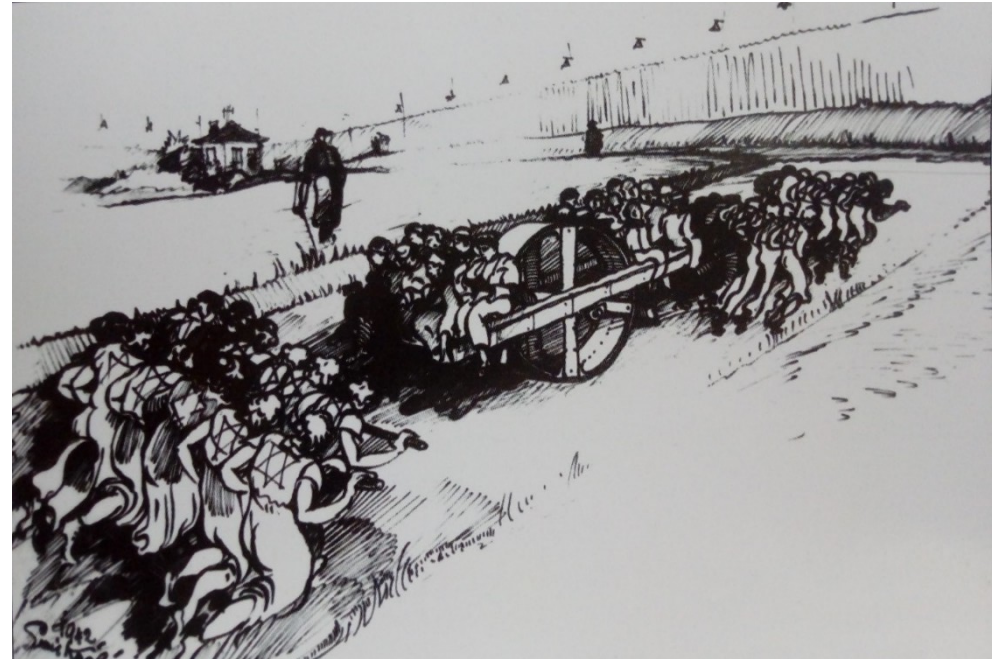
„Most vzdychov“a práca Židov tlačiacich valec pri stavbe cesty (z publikácie Slávnostní odhalení památníku a otevření muzea internačního tábora Svatobořice , 2017, s. 9; 7)