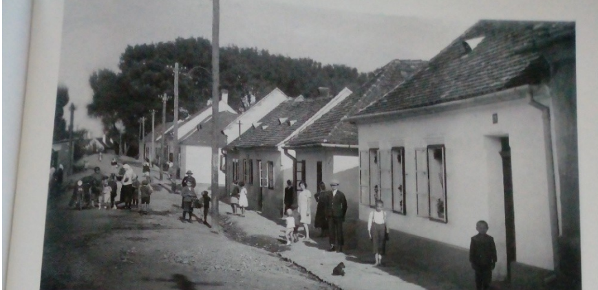
↑ Bzenecká ulice v roku 1925. (Pajer, 2002, s. 307)