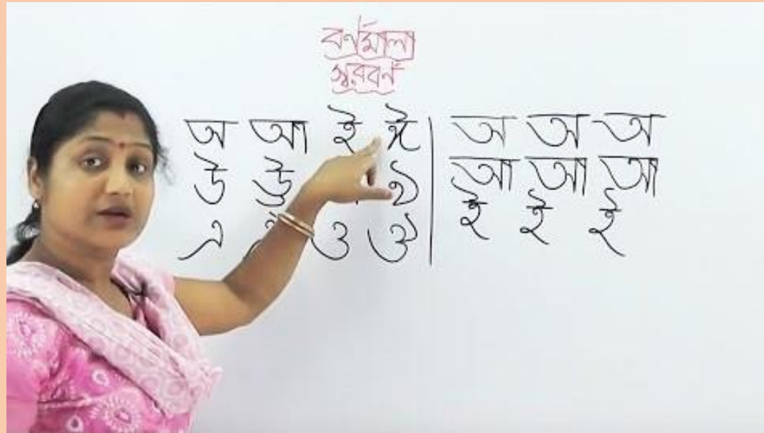
Bengálská abeceda. URL: https://www.youtube.com/watch?v=VXLykGE4Fgs

Největší počet jazyků se vyskytuje v Asii (2 300) , dále pak – v Africe (2 140), Tichém oceánu (1 310), Americe (1 060), Evropě (290).