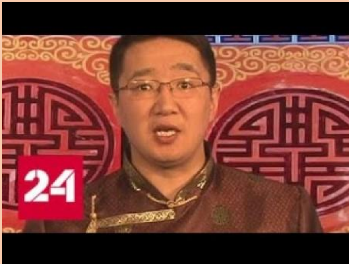
Báseň A. Puškina. Jazyky národnostních menšin Ruska. URL: https://www.youtube.com/watch?v=qBs0D1r2WBA .