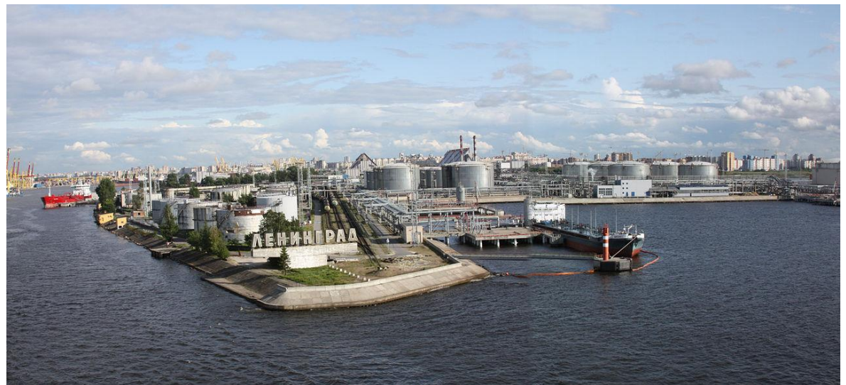
«Большой порт Санкт-Петербург»