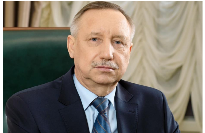
Беглов Александр Дмитриевич