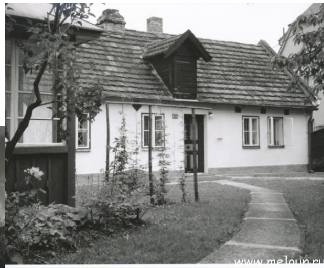
Ноябрь 1922 - август 1923 - дом пана Грубнера