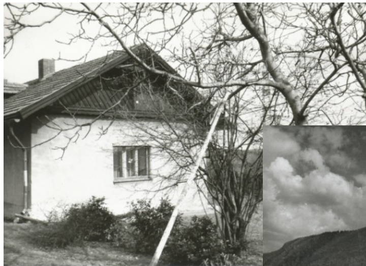
Август, 1922 год — дом лесника