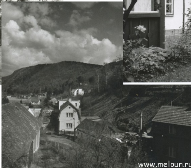
Сентябрь 1922 год — дом пана Саски