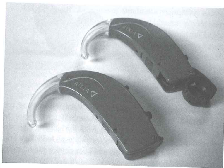
Obr. 29 Závěsné sluchadlo Widex Aikia s odklopeným krytem na baterii