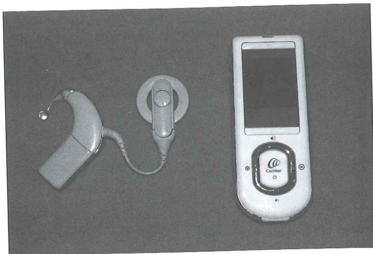
Obr. 32 Kochleární implantát Cochlear™ Nucleus® 5 a ovladač

V České republice se kochleární implantace provádějí ve dvou centrech. Jedno z nich, zajišťující implantace dospělým, sídlí na Klinice otorhinolaryngologie a chirurgie hlavy a krku 1. LFUK IPVZ FN Motol, druhé, provádějící implantace výlučně dětem, pak na Otolaryngologické klinice 2. LFUK FN Motol. Od zahájení implantačního programu v roce 1993 bylo v České republice odoperováno přes 430 dětí a přibližně 160 dospělých 37 ( http://www.ckid.cz/ ). Kochleární implantace je plně hrazena zdravotní pojišťovnou. V současné době se v ČR provádí jednostranná implantace, lze však očekávat, že se v budoucnosti i u nás začnou provádět implantace oboustranné, stejně jako je tomu v zahraničí, např. v Dánsku, Finsku, Švédsku apod.