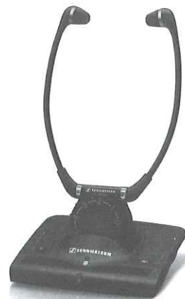
Obr. 34 Psací telefon