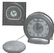
Obr. 33 Světelný budík

Podmínky pro poskytování jednorázových příspěvků sociálními odbory na opatření pomůcky pro osoby se zdravotním postižením jsou stanoveny ve vyhlášce č. 182/1991 Sb., kterou se provádí zákon o sociálním zabezpečení. Podle uvedené vyhlášky se peněžitý příspěvek poskytuje na pořízení pomůcky, kterou těžce zdravotně postižený jedinec potřebuje k odstranění, zmírnění nebo překonání následků svých