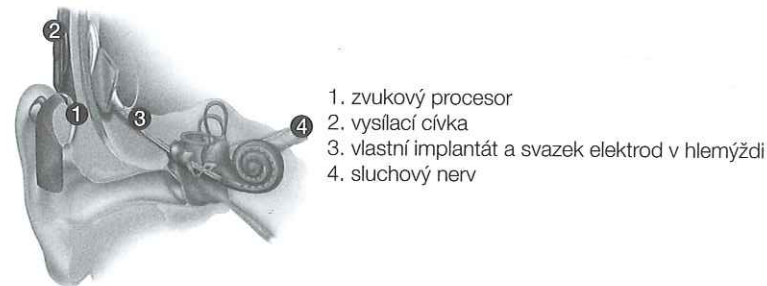
Obr. 31 Schéma fungování kochleárního implantátu

a zbytky sluchu jsou prakticky nevyužitelné. Zavedení kochleárního implantátu je nevhodné v případě sluchové vady způsobené poruchou sluchového nervu nebo centrálních sluchových drah, při chronickém zánětu středouší a při anatomické abnormalitě hlemýždě zjištěné prostřednictvím zobrazovacích metod, jako jsou výpočetní tomografie nebo magnetická rezonance. 36