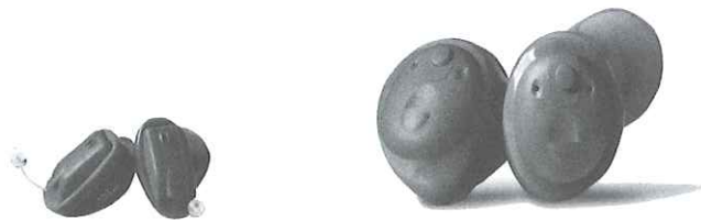
Obr. 30 Sluchadla kanálová a zvukovodová (Škodová, Jedlička a kol., 2007, s. 461)

hadičkou. Sluchadlo závěsné je nejčastěji užívaný typ sluchadla u všech věkových kategorií také proto, že dokáže pokrýt veškerou šíři ještě korigovatelných sluchových vad, podle Jedličky (in Škodová, Jedlička a kol., 2007) tedy i stavy označované jako zbytky sluchu nebo praktická hluchota.