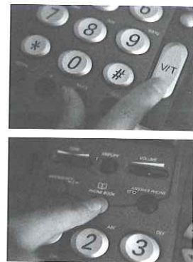
Obr. 35 Bezdrátové zařízení pro přenos zvuku

postižení. Příspěvek se poskytuje ve výši, která umožňuje opatření pomůcky v základním provedení (takovém provedení, které občanu plně vyhovuje a splňuje podmínky nejmenší ekonomické náročnosti) (Příloha 2).