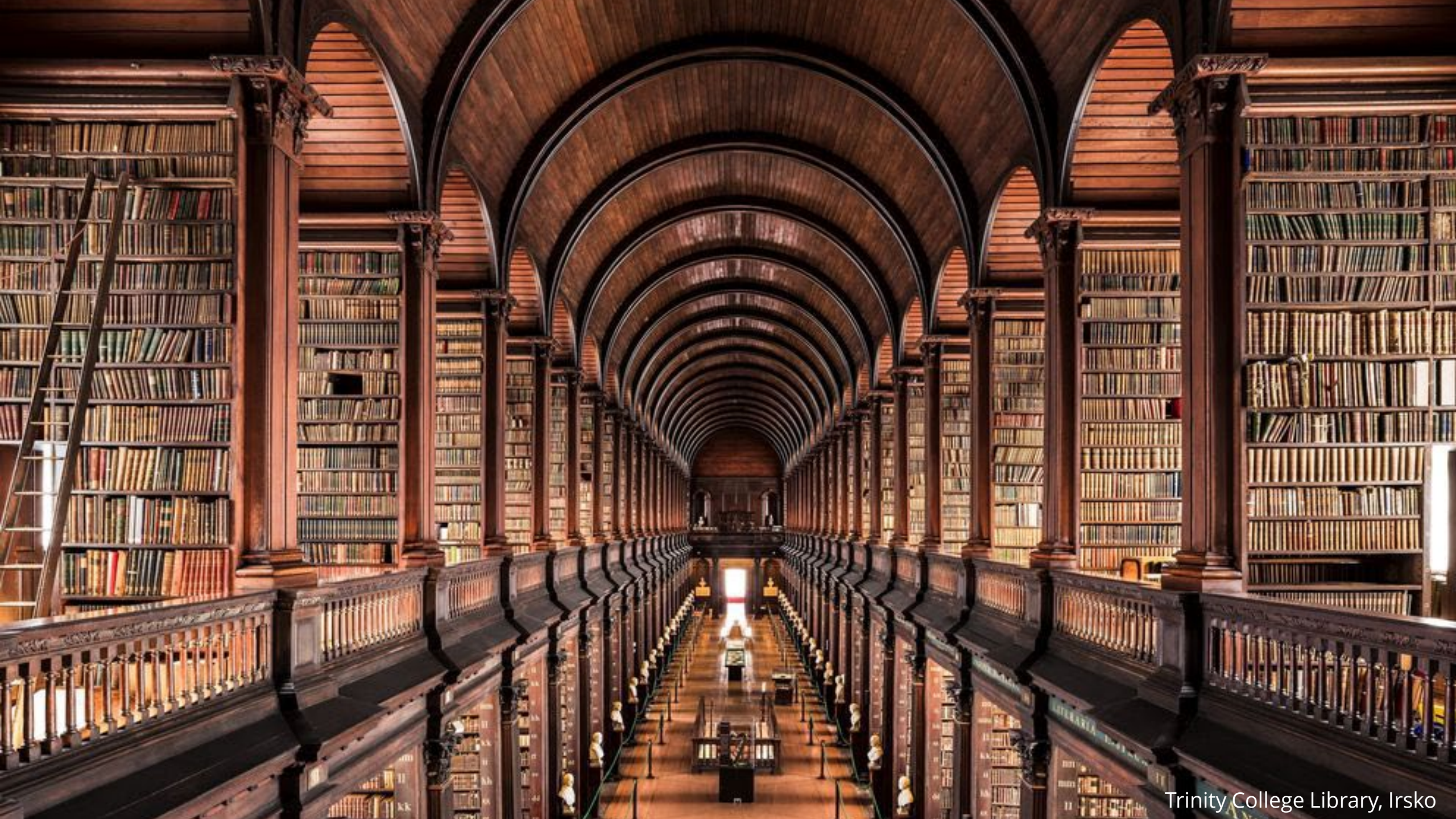
Trinity College Library, Irsko