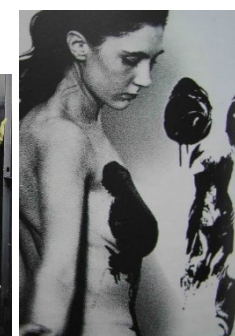
Yves Klein, 1959