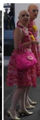
Eva a Adele