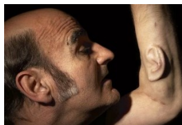
Stelarc Ear on Arm, 2011