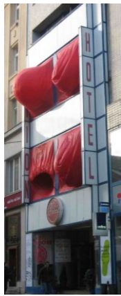
Dýchající dům Brno Art Open 2009