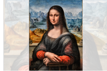
Léonard de Vinci