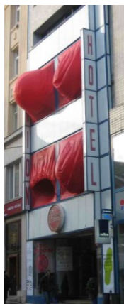
Dýchající dům Brno Art Open 2009