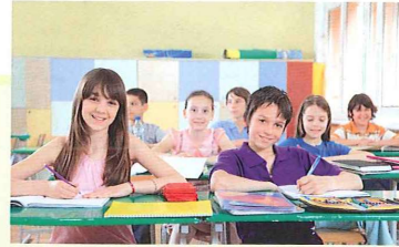
основная школа základní škola