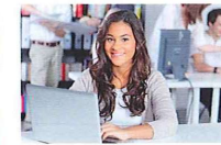
выучить naučit se