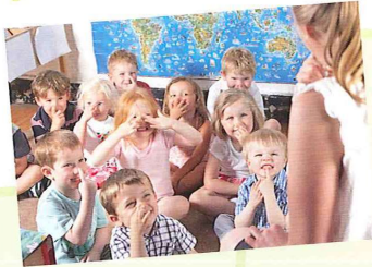
дѣтский сад mateřská škola