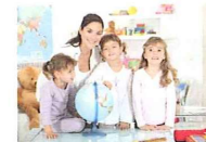
воспитательница vychovatelka, pedagog