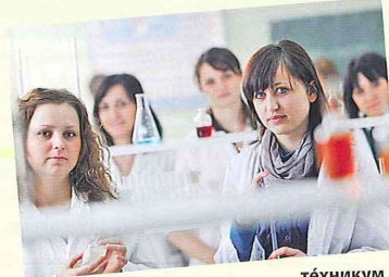
техникум střední škola

Дети дошкольного возраста ходят в детский сад. Там они играют, ходят на прогулки, слушают сказки, которые им читает воспитательница. После обеда нянечки укладывают детей спать. В начальной школе дети учатся читать, писать, считать. В старших классах – в основной школе – школьники изучают разные предметы: физику, химию, языки, математику, историю, географию и другие. В профессионально-технических (ремесленных) училищах молодые люди приобретают рабочую профессию. В техникумах студенты получают полное среднее образование по общеобразовательным предметам и приобретают знания по своей будущей специальности. Среднее образование заканчивается выпускными экзаменами, которые в последнее время стали называться ЕГЭ – единый государственный экзамен.