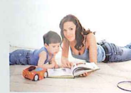
няня, нянечка chůva, pečovatelka, učitelka mateřské školy

пересдать экзамен – složit (udělat) reparát